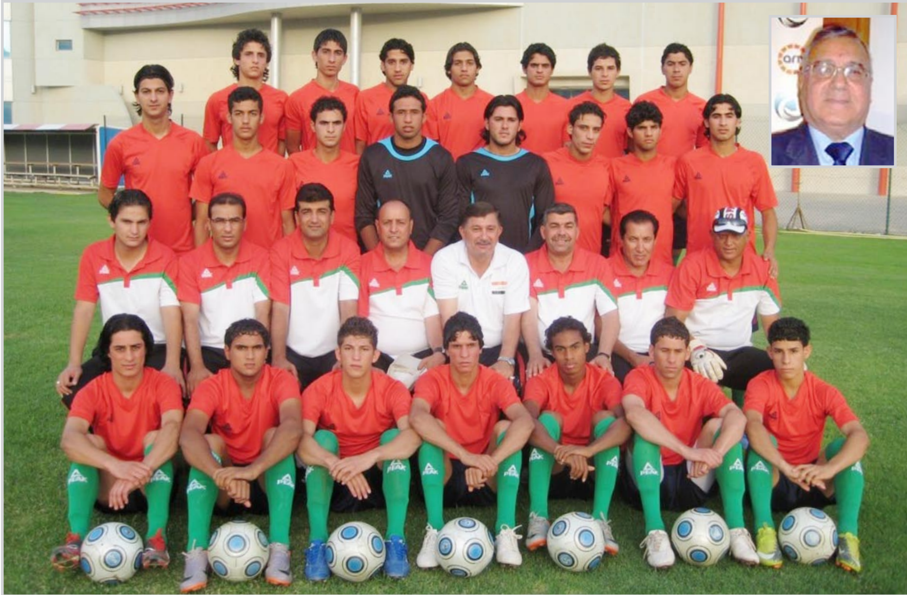
منتخب الشباب انتزع إعجاب الأصدقاء

لإقامة البطولة، ونك لأسباب عدة، منها انشغال الطلاب بإمتحانات البكالوريا، وسفر الكثير من المغاربة الى أوروبا أو إلى المدن الساحلية قبل قدوم شهر رمضان الفضيل، فضلا على حصول عدد كبير