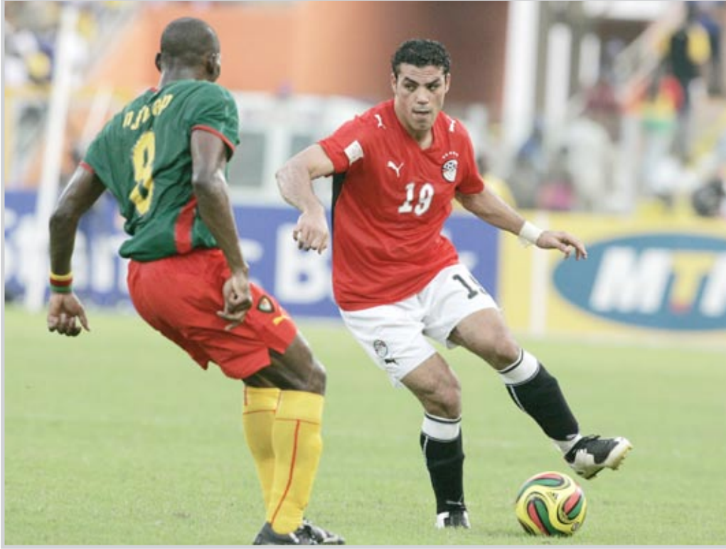
الكرة المصرية تتخلل عن شحاتة