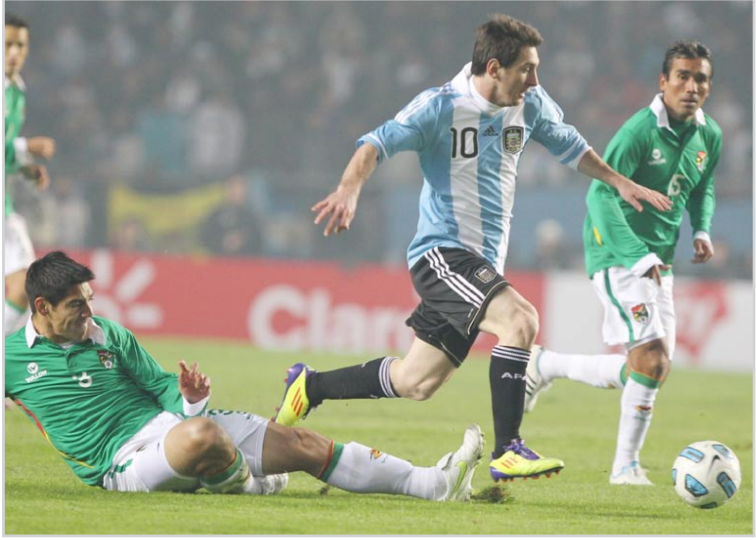
الأوروغواي إلى نصف النهائي على حساب الأرجنتين

احتكم بعدها الجاران إلى التمديد الذي كانت الفضلية خلاله لمصلحة الأرجنتين التي كانت قريبة جدا من التقدم في الدقيقة ١٠٤ عبر هيفواين لكن الحظ عاند مهاجم ريال مدريد بعدما ارتدت الكرة من القائم. ولم يطرأ أي تعديل على النتيجة في الدقائق الثلاثين الإضافية، فلجأ الطرفان إلى ركلات الترجيح التي ابتسمت للأوروغواي بعدما نجح الخصاميس فورلان وسواريز وأندريس سكوتني وولستر غارغانو وكاسيريس في المحافظة على رباطة جأشهم وترجمة ركلات الترجيح الخمس، فيما سجل ميسي