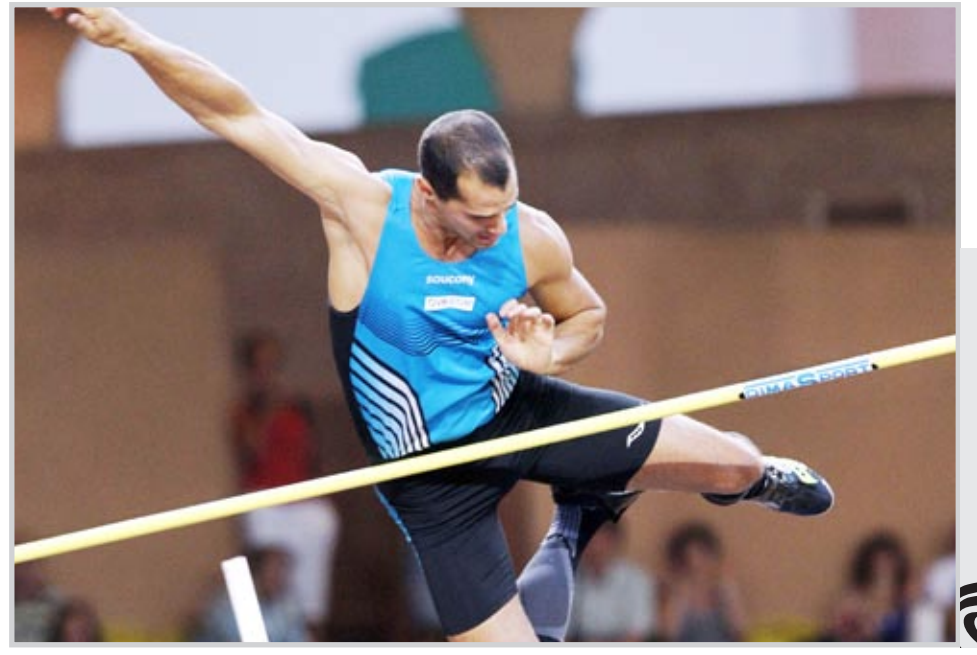
أحداث في صور