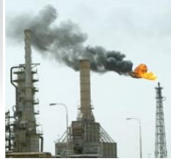
الشركة مفاوضاتها مع الحكومة العراقية للحصول على امتياز تلك المنطقة. وقيلت الحكومة العراقية الاقتراح وقامت الشركة بتأسيس شركة ملحقه بها باسم شركة نفط البصرة منحت الامتياز في مثل هذا

كان الانطباع السائد لدى أطراف التنافس على نـظـم البصرة في أوائل القرن العشرين أن الذهب العراقي الأسود كان في كركوك والموصل فحسب. وكان من صور الصراع الدولي في ما سمي بالسألة الشرقية هو الحصول على امتياز النفط في تلك المنطقتين، حتى نالت شركة نفط العراق (اي بي سي) امتياز البحث والاستخراج والبيع لنـظـم كركوك مدة ٧٥ سنة، وحددت اتفاقيتها مع الحكومة العراقية عام ١٩٢٥ منطقة الامتياز جمع أنحاء العراق ما عدا جنوبي العراق او ولاية البصرة في العهد العثماني. منح القسم غير المشمول بامتيازات أعلاه الى شركة نفط البصرة بما يشابه العقد مع شركة نفط العراق. ففي حزيران ١٩٣٠ قدم الخبراء الانكليز تقريرا سرى الى إدارة شركة نفط العراق بوجود حقول واسعة للنفط في جنوبي العراق. فبدأت اليوم من عام ١٩٣٨ مدة ٧٥ عاما، وتشمل المنطقة من رأس الخليج العربي الى جميع الأراضي في العراق التي لم تمنح لشركة نفط العراق في كركوك والموصل وخانقين. غير أن الشركة الجديدة لم تستطع البدء بأعمالها من بحث وتقيب لانعدام الحرب العالمية الثانية في عام ١٩٤٨. وفي عام ١٩٥٠ تم بنجاح فائق إنشاء خط الأنابيب من الزبير إلى الفاو، وفي تشرين الأول ١٩٥١ انساب النفط في تلك الأنابيب. واستمر احتكار الشركات البريطانية لنـظـم العراق، وعدلت الاتفاقيات المبرمة معها لمرات عديدة، وأصبح للجانب العراقي شيء من القوة والمناورة بعد صدور القانون رقم ٨٠ لسنة ١٩٦١، حتى اممتت تلك الشركات ونقلت ملكيتها إلى الحكومة العراقية عام ١٩٧٢ والسنة التالية. اعداد: رفعة عبد الرزاق