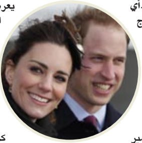
نيويورك / بي.بي. أي.

يعرض الكثير من الأشياء التي لا يعرفها الناس عن حب ويليام وكيت. وقال الممثل دان أمبور إن الفيلم سيضم أيضاً شخصية الأميرة ديانا، حيث إن دورها كان مؤثراً في العلاقة بين ويليام وكيت، كما أنه لا ينبغي تجاهل الجانب الأسري، ومن المقرر أن يتم دعوة الأمير ويليام وزوجته كيت لحضور عرض الفيلم للمرة الأولى الشهر المقبل.