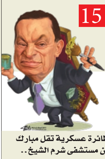
15 طائرة عسكرية تقل مبارك من مستشفى شرم الشيخ..