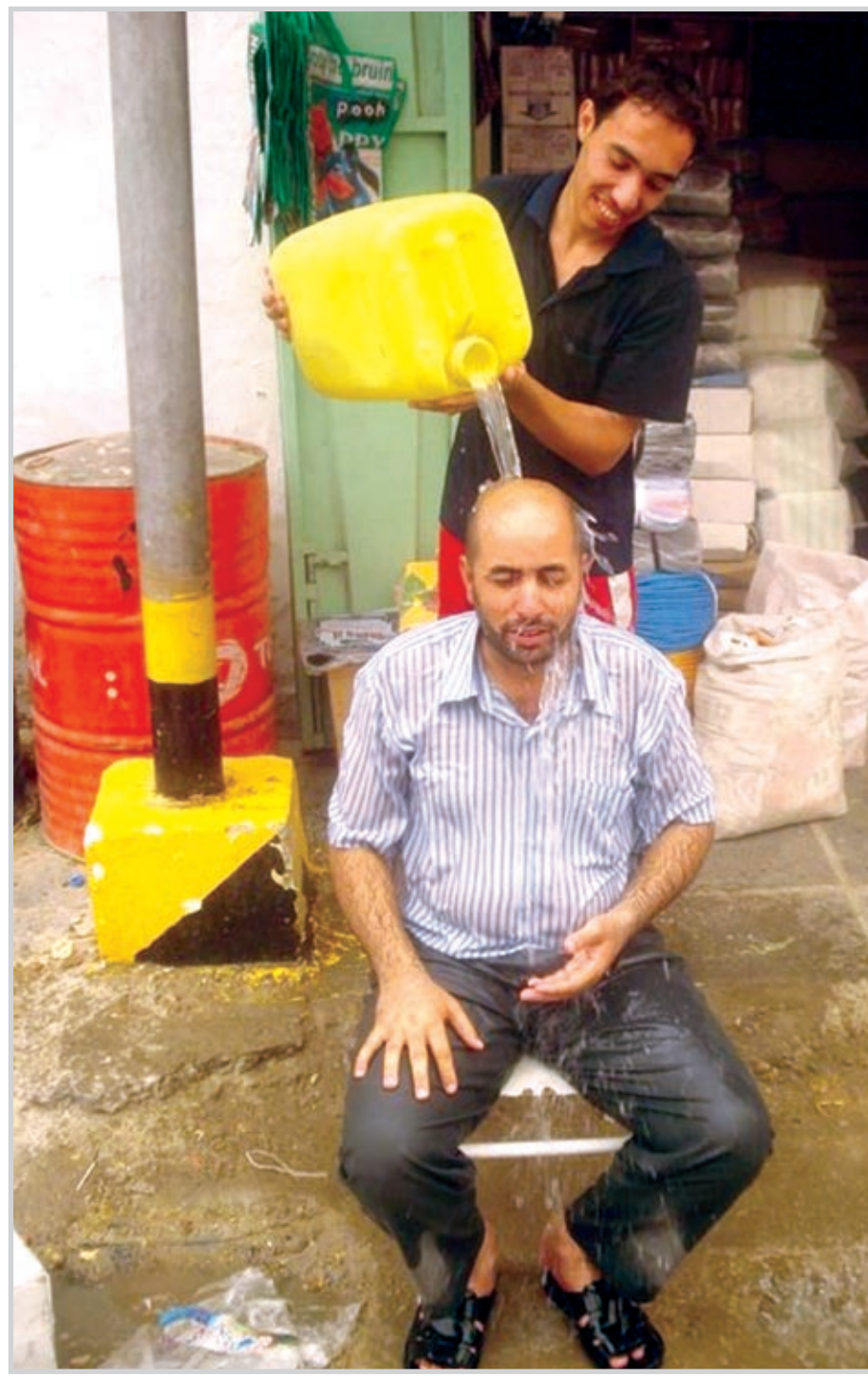
عراقيون يلهون في الماء هرباً من حر الصيف..