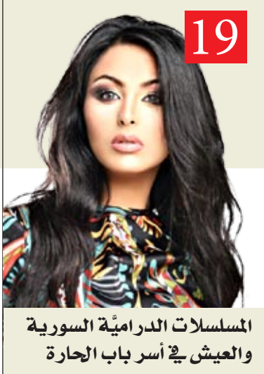
19 المسلسلات الدرامية السورية والعيش في أسر باب الحارة

http://www.almadapaper.com Email: almada@almadapaper.com