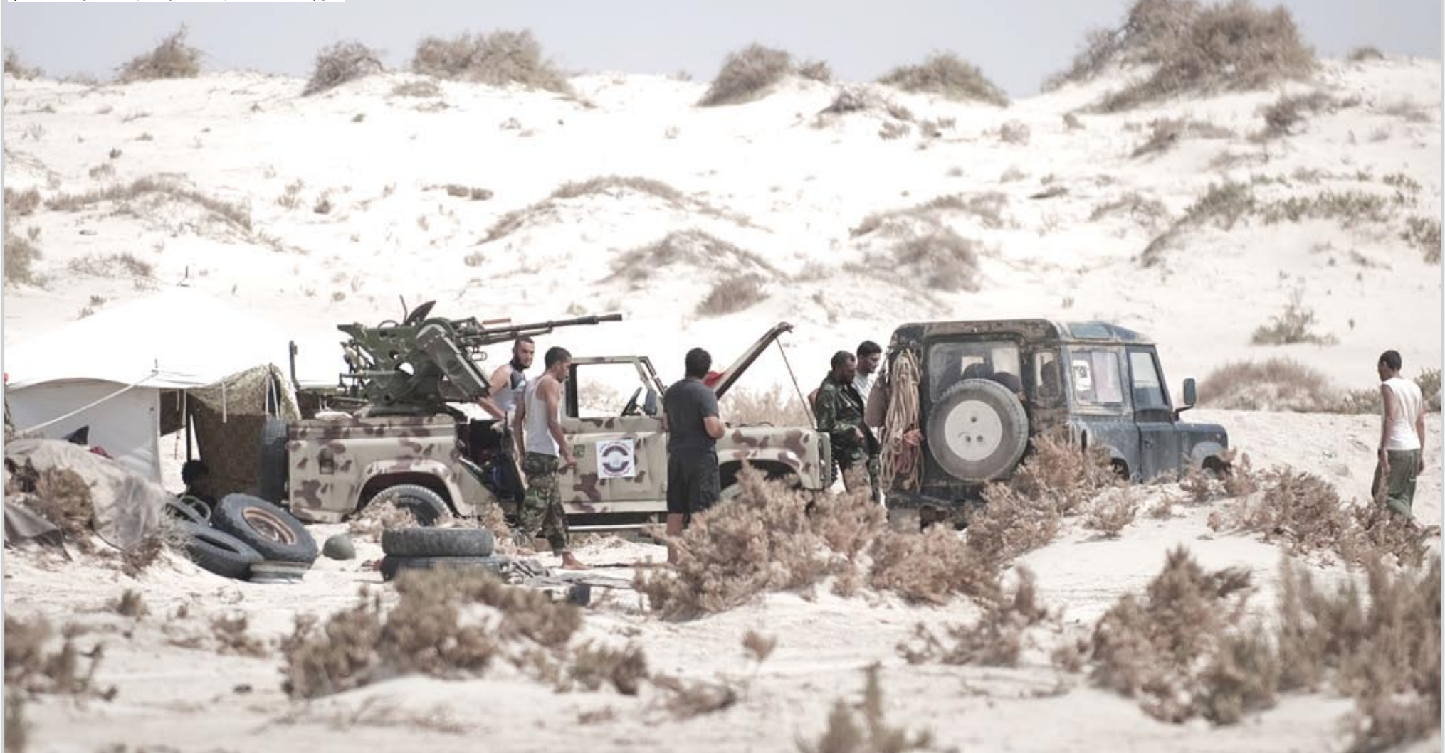
طرابلس، المسافة اصحبت اقصر من قبضة الثوار ... أف ب

كما شنت المخابرات العسكرية مدعومة بالمدركات حملة اعتقالات واسعة في دير الزور حيث قتل أربعة أشخاص الخميس خلال عمليات دهم وتفقيش من منزل منزل بينما تم اضرار النار في منازل وممتلكات نشطاء المعارضة في المدينة حسبما افاد المرصد السوري لحقوق الانسان. وأعلنت لجان التنسيق المحلية التي تتولى أعمال الاحتجاج ان تسعة أشخاص قد قتلوا تحت التعذيب في السجون السورية خلال الأيام العشرة