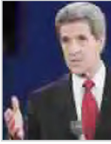
بوش يوبخ خصمه كيري: العالم أكثر خطورة اليوم لأن الرئيس لم يتخذ القرارات الصائبة

برامج نووية". بينما دافع بوش عن قراره بدخول الحرب، وهاجم بقوة سجل كيري قائلا "ان استعداد كيري لتغيير موقفه وفقا