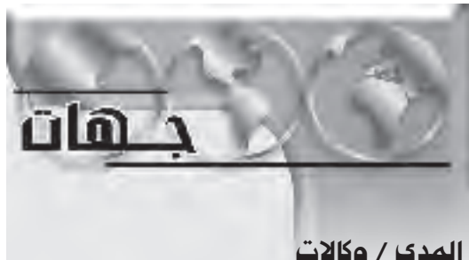
المدا / وكالات

نزع أسلحة دعت القمة الآسيوية الأوروبية الخامسة التي اختتمت السبت في هانوي الى نزع اسلحة الفصائل في افغانستان معبرة عن ارتياحها لتنظيم انتخابات في هذا البلد. واتفق قادة الدول الأوروبية والآسيوية المشاركون في القمة على تأكيد ارادتهم المشتركة في تولي الامم المتحدة قيادة حملة مكافحة الارهاب لكنهم لم يتوصلوا الى اتفاق واضح حول الاتحاد الأوروبي و٣١ بلدا آسيايا "أكدوا دعمهم لاعادة اعمار افغانستان وحلال الاستقرار فيها". لكنهم عبروا عن قلقهم "للتهديد المستمر الذي تشكله النشاطات الارهابية وتهريب الافهون". مؤكداين "الحاجة الى نزع اسلحة الفصائل المسلحة". كما عبروا عن املمهم في ان "تجلب الانتخابات السلام والامن الى هذا البلد".