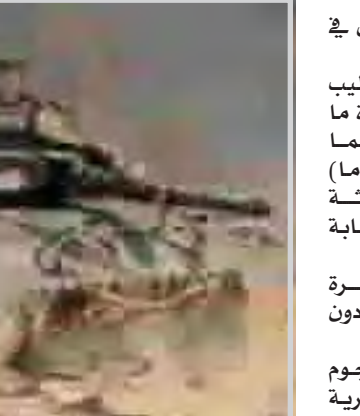
الوكالات الدولية تحت ظهران لوقف برنامجها النووي

دمشق (اف ب) - قال الرئيس السوري بشار الاسد أمس السبت ان سوريا ترفض اجراء مفاوضات "سرية" مع اسرائيل وقال ان "وساطة ومن كل انحاء العالم" حاولوا اقناع دمشق بها. واوضح الاسد امام ٣٠٠ شخص في افتتاح مؤتمر للمغتربين السوريين في قصر الامويين في دمشق ان "هناك العديد من الوسطاء الذين كانوا يأتون الى سوريا من دول اوروبية وجمهورية الولايات المتحدة بهدف اجراء وساطة تتعلق باستئناف المفاوضات بين سوريا واسرائيل". واضاف ان "بعضهم طرح