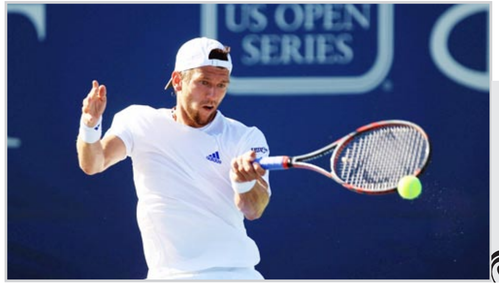
أحداث في صور