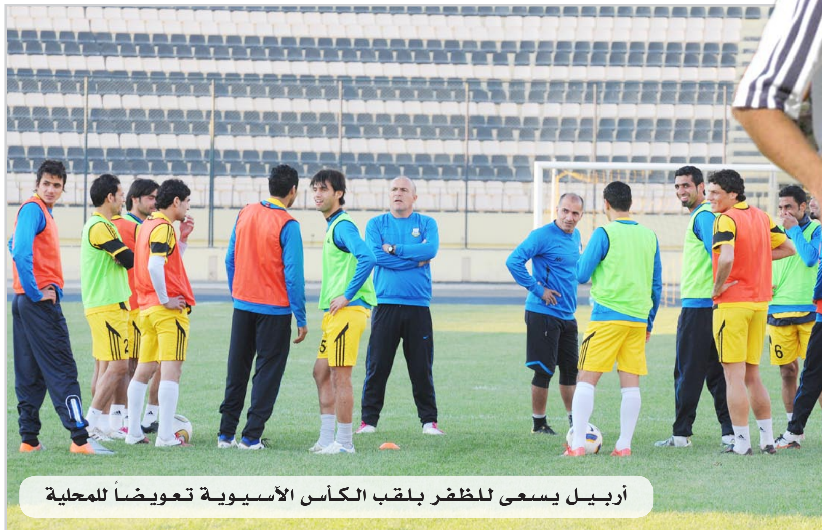
أربيل يسعى للظفر بلقب الكأس الآسيوية تعويضاً للمحلية