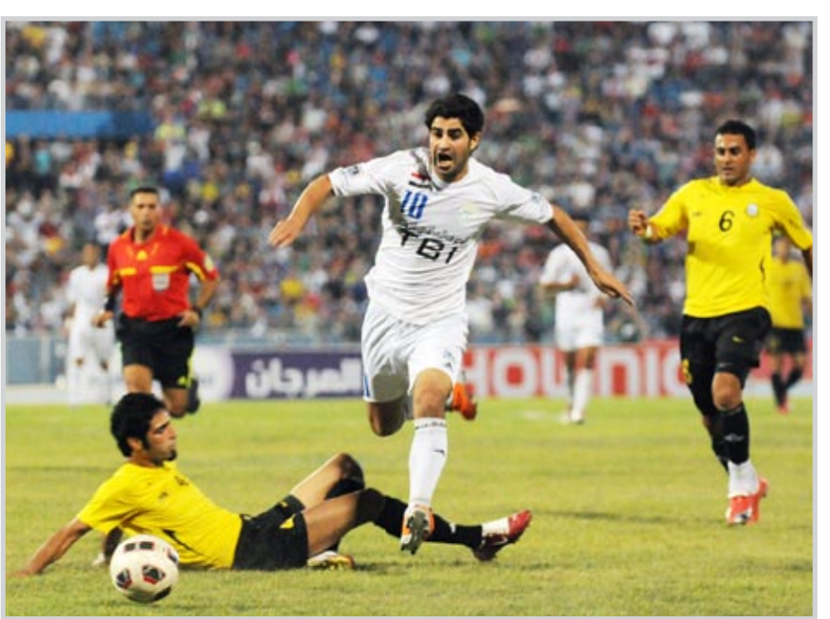
فريق الزوراء يتربص مدربه القادم