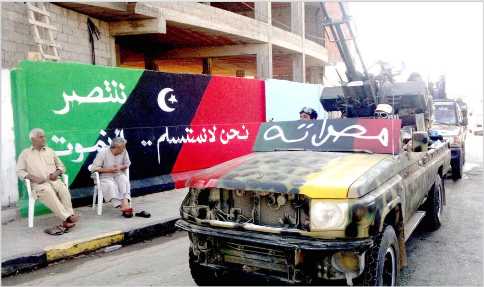
مصراته، قاعدة مهمة في الطريق الى سرت...

وأضافت كاترين آشتون، في بيان لها اليوم، عقب الاجتماع تلتق وكالة أنباء الشرق الأوسط نسخة منه "لقد اتفقت خلال هذا الاجتماع تحت قيادة الأمم المتحدة - على دعوة كافة الأطراف إلى احترام التعهدات الدولية الإنسانية وحقوق الإنسان مؤكدة أنه يجب ألا تكون هناك أي أعمال انتقامية". وأوضح أن الأطراف المشاركة في اجتماع مجموعة القاهرة أكدت أن التحول في ليبيا يجب أن يكون تحت قيادة ليبيا، وأن يكون شاملا وينبغي أن يحترم كافة الشركاء قيادة ليبيا وسيادتها. كما يجب أن يتم بذل كل جهد ممكن من أجل تعزيز المصالحة