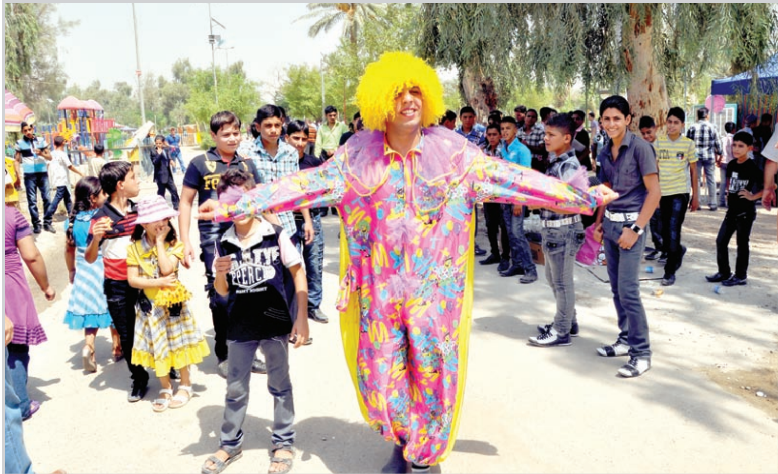
بهلوان يستعرض مهاراته في إحدى متنزهات بغداد..