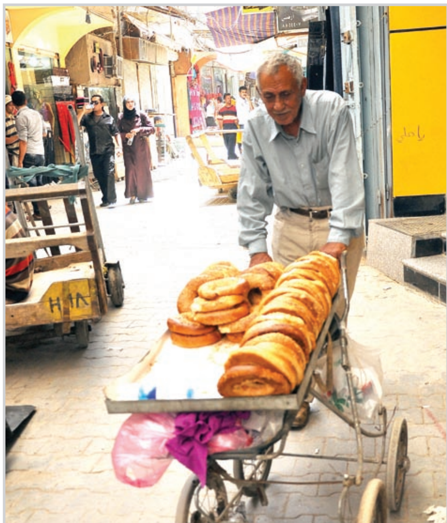
بائع معجنات جوال في اسواق بغداد..