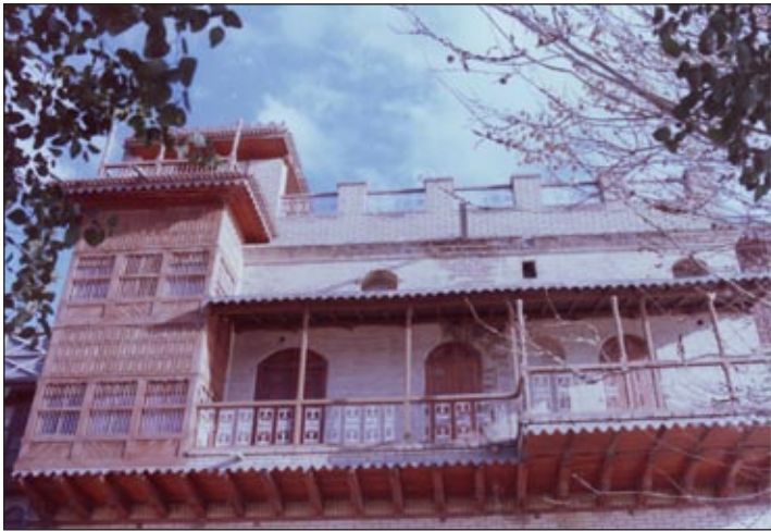
متحف الفنانين الرواد في شارع الرشيد

عن كِتَاب (شارع الرشيد) مجموعة بحوث ومقالات