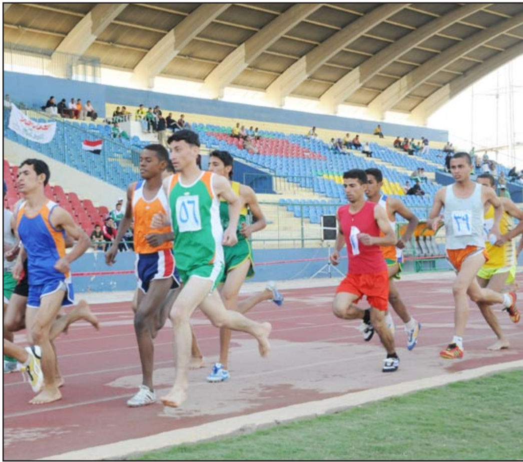
اللاعب المصرية تحضر المنتخبات العراقية للبطولات المقبلة