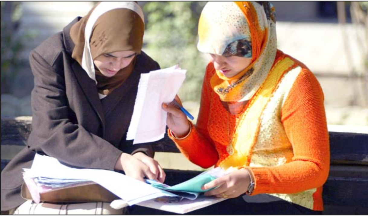
رحلة البحث عن وظيفة

العامل الفردي.. شروطه، وحقوقه، والعمل، وبين أحكام الأجور من حيث الدفع، والحماية، المساواة، والمكونات على ألا يقل عن الحد الأدنى للأجر، وخصص أحكام وقت العمل بـ ٨ ساعات، وفترات الراحة، والإعمال الإضافية، وأحكام الأعمال التحضيرية والظروف القاهرة. وقال إن مشروع القانون عالج منازعات العمل الجماعية، وبين أسلوب حلها بالتشاور والتحكيم ومحكمة العمل وتقديم إشعار بالنزاع والنية بالإضراب، واعتبار الدعوى مُستعجلة، وقابلة للطعن، وإعفاء العامل