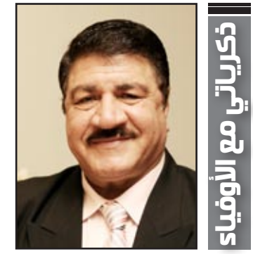
بقلم / الدكتور عبد القادر زينل

الذكريات .. روفا تصب في مسار الحياة .. يسقط منها ما قد يؤثر سلباً في المسار .. ويتربس منها في وعاء الذاكرة ما يؤثر إيجابياً في مسارنا الطويل فيتحقق ما يقوله الشاعر : (ان الذكريات هي معنى العمر في هذه الحياة) .. وفي سياق الذاكرة رجال اسهموا بهذا القدر او ذاك في بناء شخصيتنا وتحدد نيتنا ومستقبلنا .. نرفعهم في بيارق الذاكرة .. وفاء لهم ولما قدموه .. هذا الوفاء هو الرابط الانساني الذي يبقى ينكرنا بالبقولة (من علمني حرفا ملكني عبداً) الى هؤلاء جميعا اخني رسوا احتراماً والى ذكراهم اقدم لهم كلماتي التي يحكيها القلب والضمير . لا شك ان الحديث عن رواد الصحافة في العراق يعيد لسنوات طوال، وتاريخ عريق حافل بالمحطات الزاهرة بالعباءة الثر، بوجود نخبة من الاسماء اللامعة التي حفرت اسمها في هذا المضمار بالحرف من نور وبجهد استثنائي وكفاءة متقطعة النظرية ومهنية عالية بانث أنموذجاً يحنى به حتى يومنا هذا ومثالاً لاجيال القادمة، ولأنك ان استنكار هذه الاسماء الكبيرة بعتابها وحبها للمهنة، ليس بالامر الهين، كما يوجد من هؤلاء من يستحق كل تقدير واحترام لما قدمه من جهد وعرق من أجل الكلمة الصادقة طالما كانت الصالحة العامة هي الهاجس الاكبر لدى الكثيرين