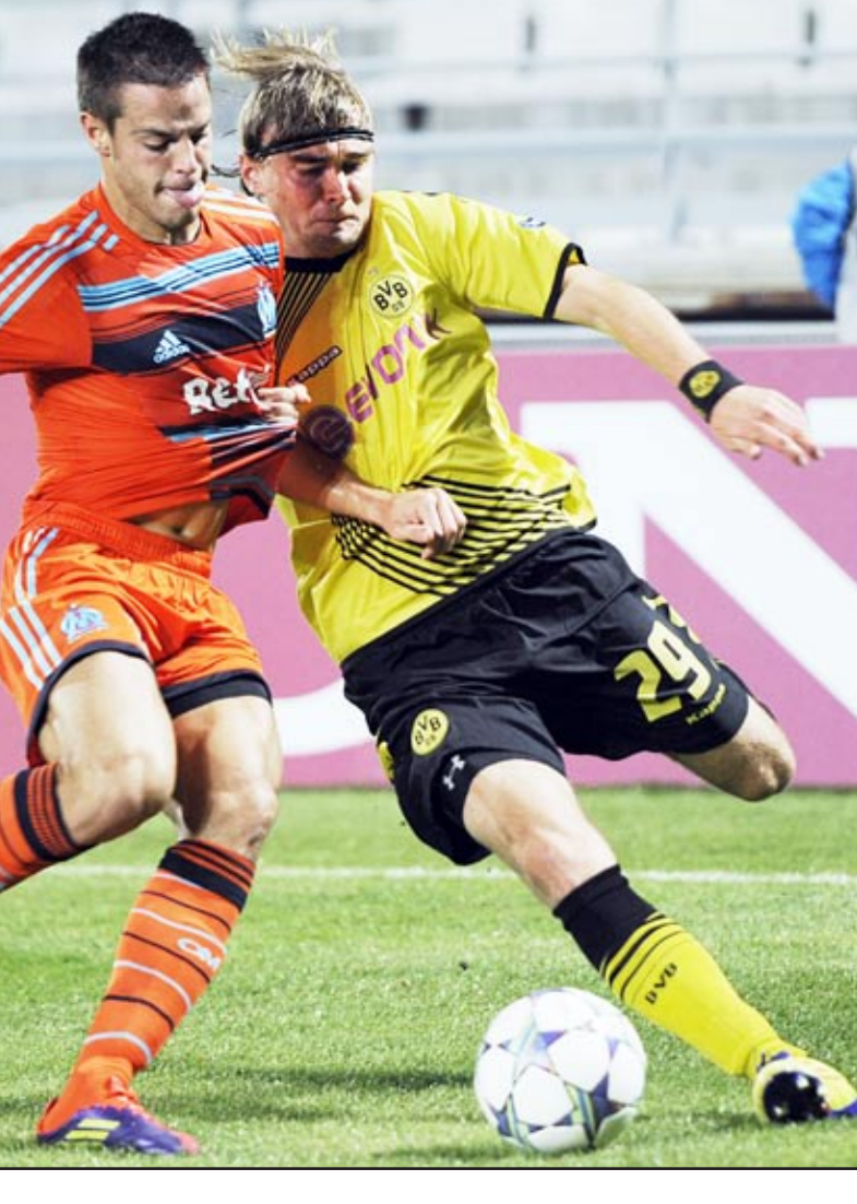
سقوط لاتسيو على أرضه

وكان سان جيرمان فاز في الجولة الأولى من يورو ليغ في ١-٣ على سالزبورغ النمساوي ١-٣ في حين فاز بلباو على سلوفان براتيسلافا السلوفاكي ٢-١ محقق.