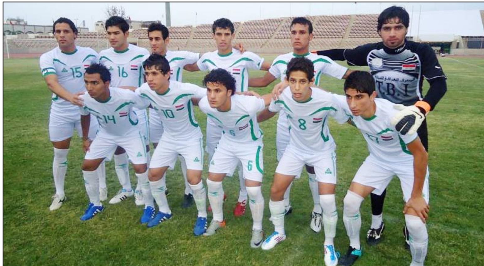
المنتخب المدرسي في لخر ظهور له بالسعودية