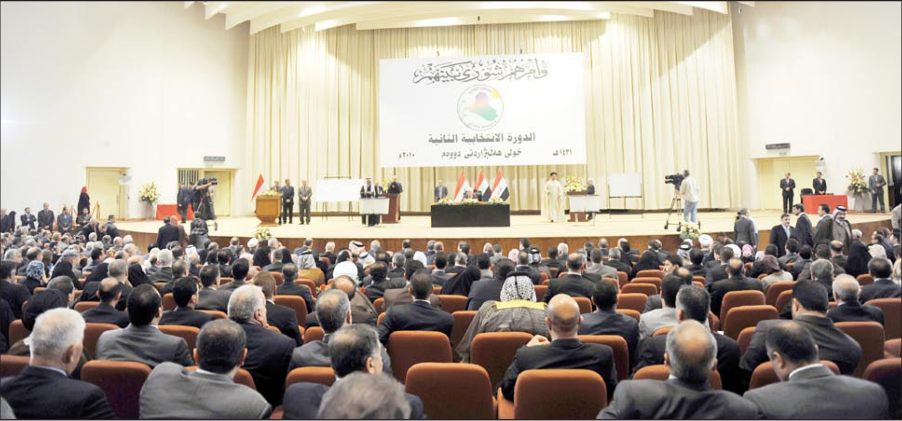
● مجلس النواب.. (أرشيف)