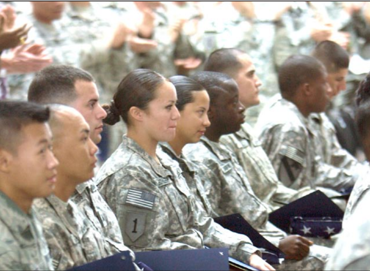
اغلب الكتل السياسية مجمعة على عدم منح الحصانة للمدربين الأميركيين..