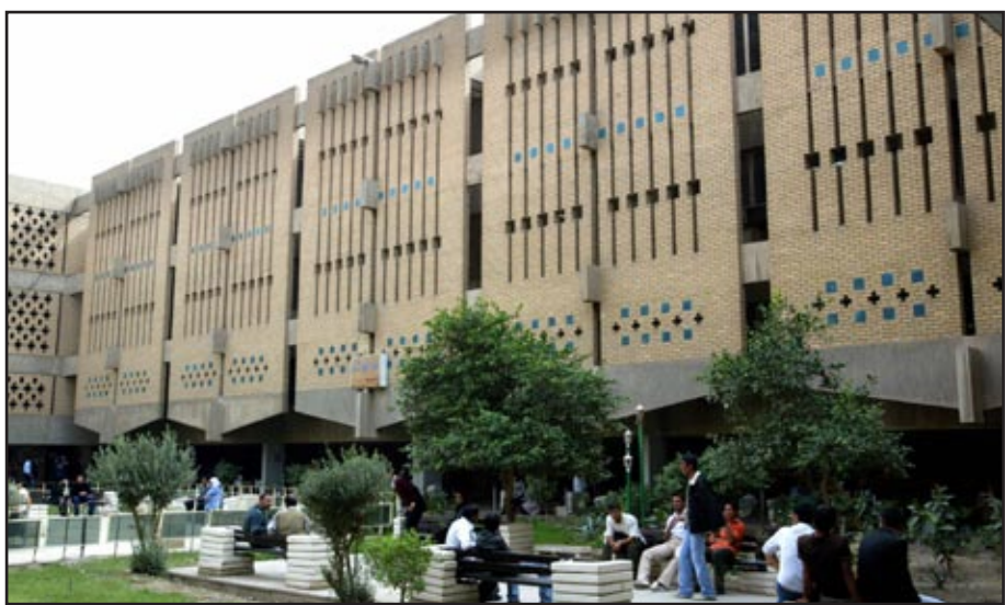
الجامعة المستنصرية.. ارشيف

وأضاف مدير الإعلام أن وزير التعليم العالي "تفقد القاعات الدراسية في الجامعة والتقني طلبة الكليات واستمع إلى مقترحاتهم ورؤاهم حول الواقع التعليمي والخدمي في الجامعة"، مشددا على ضرورة "أن يجدي طلبة جامعة كربلاء وكل الجامعات العراقية، أقصى ما يمكنهم من جهود لارتقاء بمستواهم العلمي والمساهمة في بناء العراق". وتفقد الأديب "البنابات قيد الإنشاء التابعة لمجمع جامعة كربلاء الجديد، واطلع على مراحل الانجاز في المجمع".