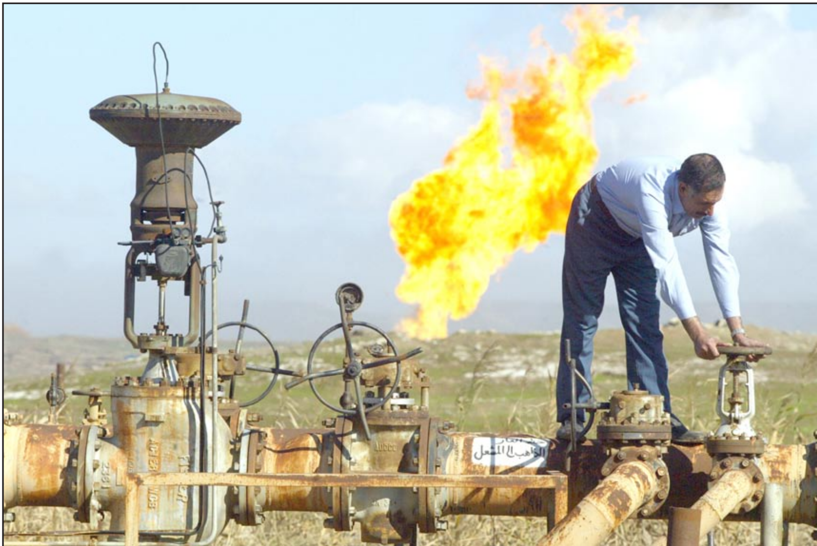
مشاة نفطية عراقية

المشروع بالمواد المطلوبة للمنشآت النفطية والتي تسمح باستثمار الغاز والنفط، أو مع الشركات النفطية الكبرى المستثمرة من أجل الحصول على تلك المواد الأولية واستكمال عمل إقامة منشآتها البتروكيمياوية، مبيناً أن "الهيئة جاهزة لمنح المشروع إجازة استثمار تعطي غطاء قانونياً للمشروع". وأوضح البدران أن "إجازة الاستثمار التي تمنحها الهيئة ستعطي مميزات أخرى كإعفاءات الضريبة للمواد المستوردة له والضمانات، إلى جانب تقديم الدعم الحكومي لاستحصال سمات الدخول لكوادره المتخصصة وتوفير الحماية المطلوبة". وكانت شركة وقود القطرية أعلنت في 27 من شهر أيلول الماضي، عن تقديم عرض لهيئة استثمار البصرة لإبناء مستودعات نفطية للدعم اللوجستي لشركات النفط العاملة في البصرة. وأعلنت وزارة النفط العراقية، في 12 تموز 2011، عن توقيعها بالأحرف الأولى، اتفاقية لاستثمار الغاز في حقول النفط الجنوبية مع شركتي شل وميتسوبيشي، وفي حين أكدت أن الاتفاقية ستعزز الطاقة الإنتاجية للغاز المسال إلى 2,5 مليون قدم مكعب قياسي، أكدت أن الاتفاقية ستفتح الباب واسعاً أمام دخول العراق السوق العالمية كمنافس قوي. وتشير التقديرات الأولية إلى أن العراق يمتلك مخزوناً يقدر بـ 112 ترليون قدم مكعب من الغاز، إلا أن 700 مليون قدم مكعب منه يحترق يوميا ويهدر بسبب عدم وجود البنية التحتية. وكان مجلس الوزراء العراقي وافق خلال حزيران 2010 الماضي، على فتح باب استثمار الغاز المصاحب المنتج في حقول نفط الجنوب الواقعة قرب البصرة، بكلفة تصل إلى 12 مليار دولار وتمتلك الحكومة فيه حصة 51 بالمئة.