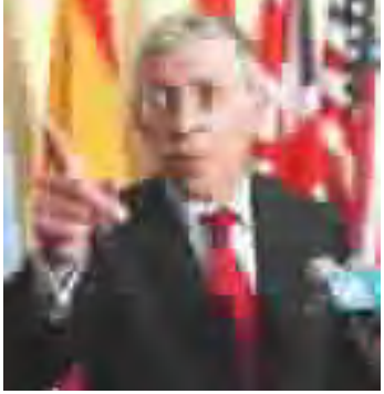
وزير الخارجية البريطاني

المدن كمدينة النجف والصدر والفلوجة ووضح داود للاعضاء الاسباب التي دعت الحكومة لاستخدام الخيار العسكري بعد ان استنفدت كل الوسائل المتاحة من اجل حل التوترات الامنية حلا سلميا، كما اشار داود خلال حديثه للاعضاء الي ضرورة توفير الدعم اللازم للحكومة واجهزتها كافة من اجل بسط سلطة القانون في كل ارجاء العراق.