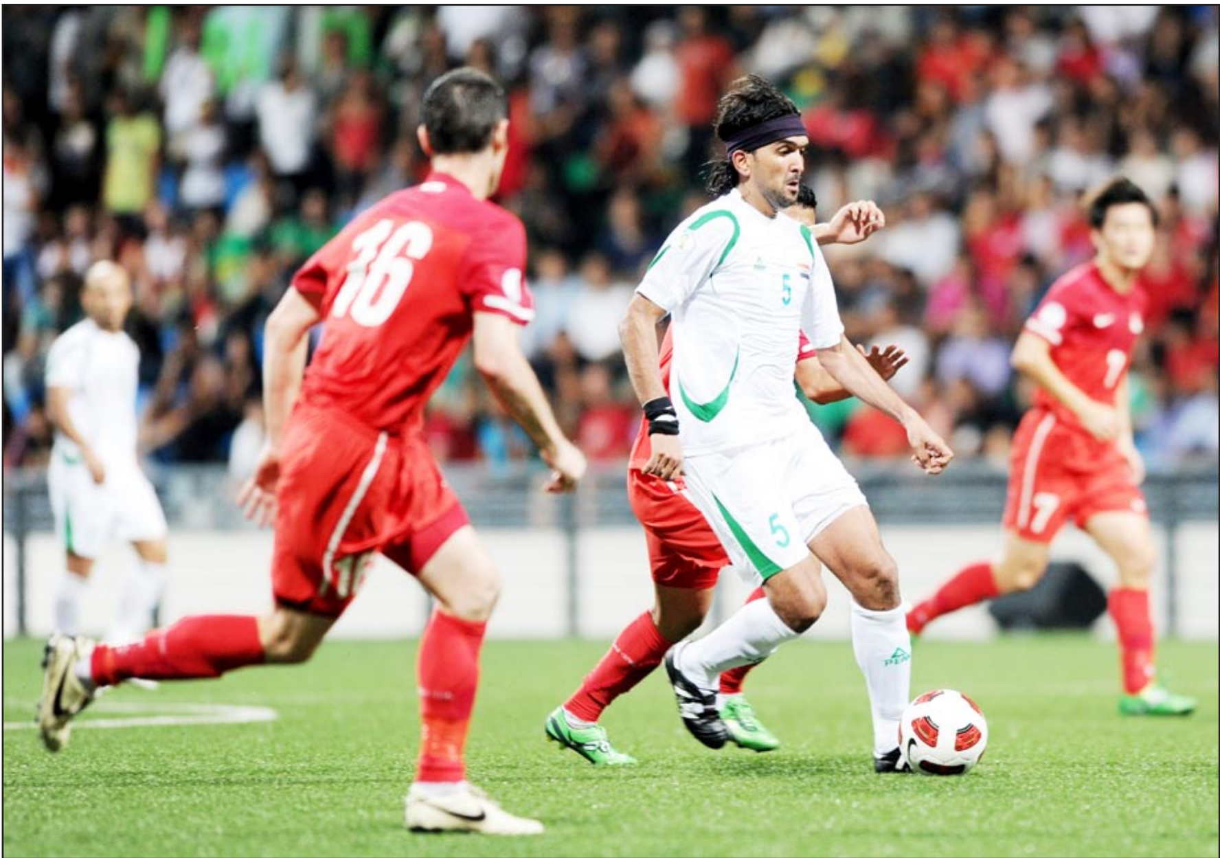
منتخبنا الوطني قهر الصين ووسع اماله الموندبالية

فؤاد محمد صيني مسلم في المرحلة الرابعة من الدراسة الجامعية (لغة عربية) يتحدث اللغة العربية بطلاقة احتجابه بعض الاحيان في الترجمة أكد لي احدى الوحدات التدريبية لمنتخبنا التي رافقتني فيها حيث قال : "معلوماتي تؤكد ان المنتخب العراقي قوي ويستطيع الفوز في اية لحظة ومتى ما يقرر نك وهذا ما يخيفني في مباراته امام منتخبنا بعد ايام" . وأضاف : "لم ابق بفريق بلدي واتوقع خسارته امام العراق وجميع الجمهور الصيني يشاركني هذا الرأي وهو جمهور محبط ، لأن فريقنا لم يقدم الاداء الطيب في المباراتين السابقتين اللتين فاز في الاولى على ستغافورة بصعوبة على ارضه واسام جمهوره وخسر الثانية امام الاردن ، لذلك فان الجمهور ينظر الى الفريق نظرة متشائمة .