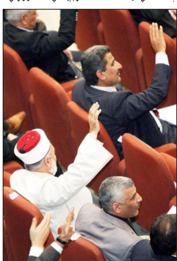
النواب يبرفهم يديهم لرمي الجمرات في الحج