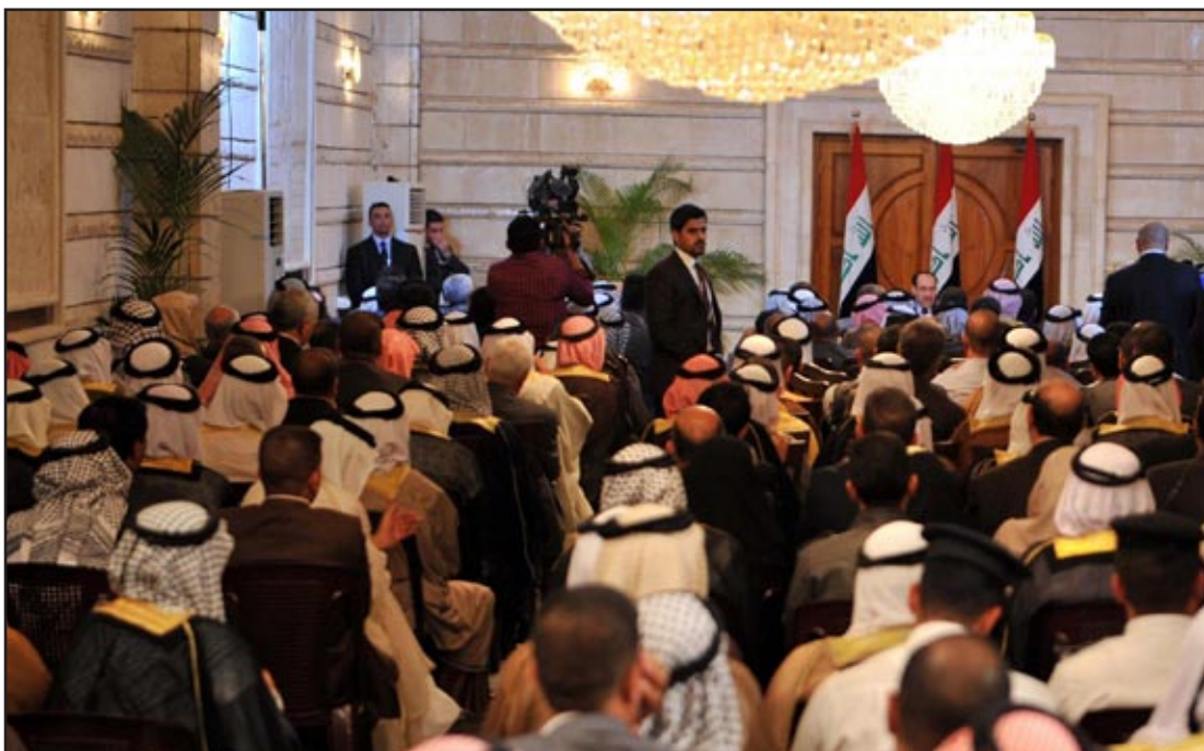
الملك خلال لقائه وقد عشائر صلاح الدين أمس الأول... أرشيف

وأضافت "لقد اشترطت لنجاح الاستفتاء أن يحصل على أغلبية المصوتين من الناخبين في كل محافظة من المحافظات التي تريد الانضمام إلى إقليم فقط". وأوضحت أن "هذا القانون ينطبق فقط على المحافظات التي تريد أن تنضم إلى إقليم كردستان كونه الإقليم الوحيد في العراق". وأشارت الرئيس إلى أنه "ينبغي إجراء تعديل على هذا القانون من قبل مجلس النواب قبل الشروع بأي إجراء من إجراءات تشكيل أي إقليم جديد يتكون من محافظة أو أكثر". وكان مجلس محافظة صلاح الدين قد