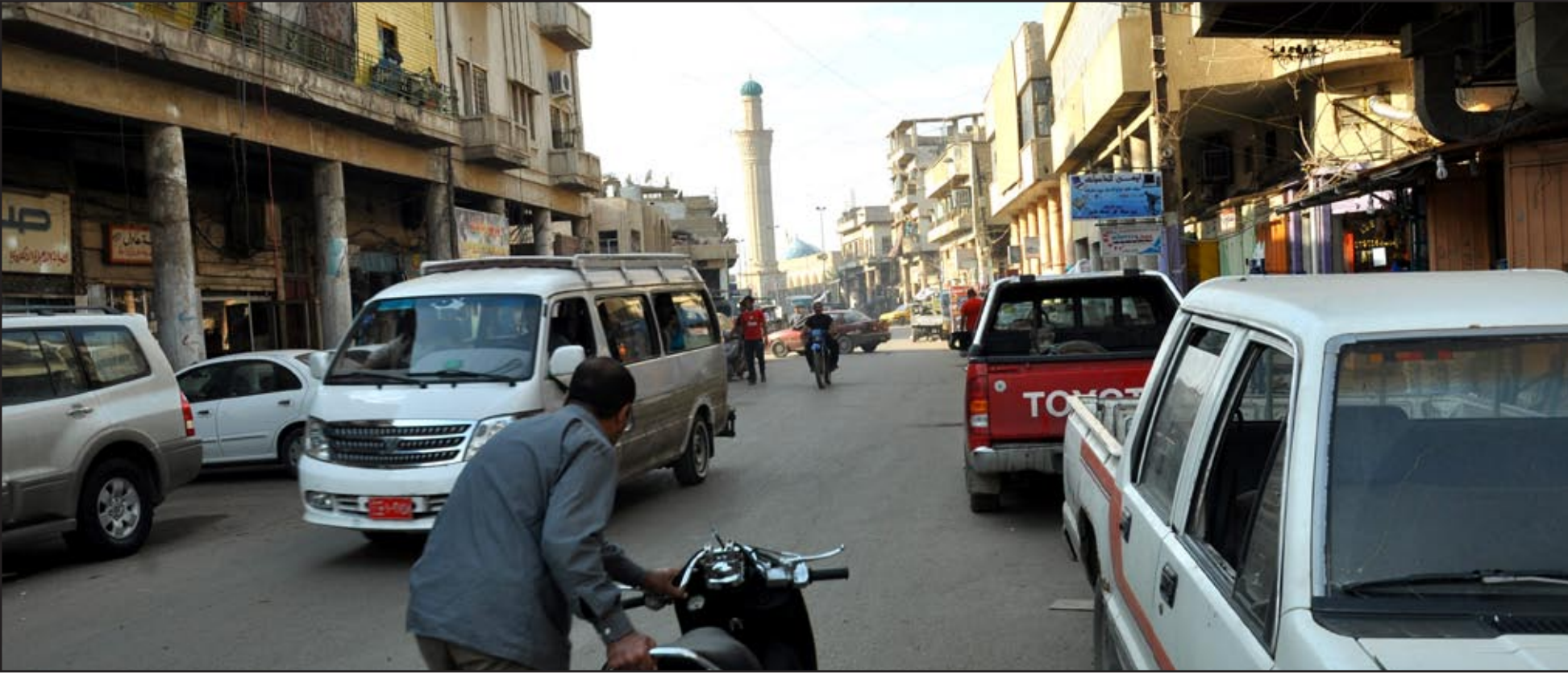
مئذنة الكيلاني من شارع الكفاح