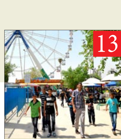
13 ثالث العيد: زحام.. سيطرات أمنية.. أسعار مشتعلة