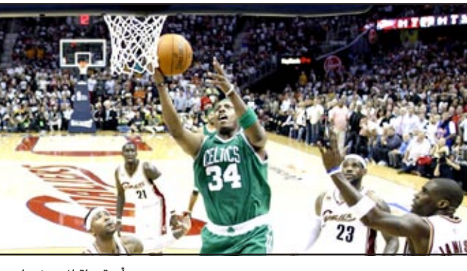
أزمة سلة المحترفين لم تحسم بعد

منحتها رابطة الدوري الأميركي إلى اللاعبين للرد على مقترحات الرابطة. وبذلك، ازداد الموقف تأزماً وتضاعفت حدة القلق بشأن بداية فعاليات الموسم الجديد ٢٠١٢/٢٠١١ التي تأجلت بسبب هذه الأزمة. وسبق للاتحاد اللاعبين أن رفض اقتراح الرابطة صباح الاثنين