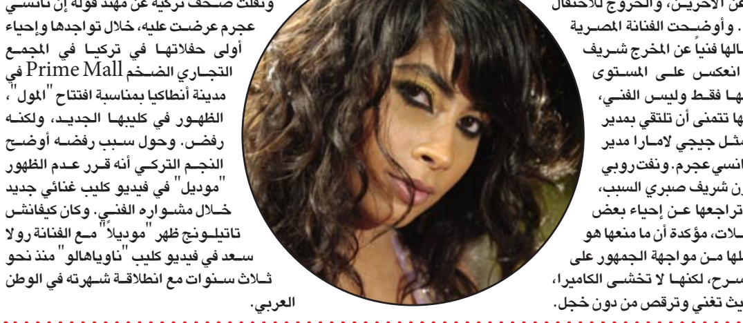
جمال جنيفر لوبيز يمنحها لقب شخصية عام ٢٠١١

ظهرت المغنية الأميركية ماريا كاري في برنامج "The Rosie Show" على محطة اوبرا "OWN" وكشفت خلال المقابلة كيف خسرت ٧٠ باوندا من وزنها وكان الأمر واضحا من خلال ملابسها فكانت تردي تنورة قصيرة جدا مع جاكيت جلدي ضيق. ويشار إلى أن ماريا وضعت توأما في ٣٠ نيسان يوم عيد زواجها الثالث من المغني ومقدم البرامج نيك كانون.