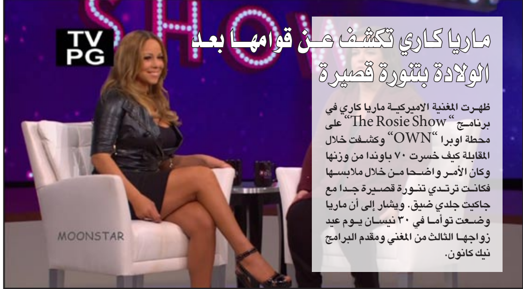
ماريا كاري تكشف عن قوامها بعد الولادة بتثورة قصيرة

متد سنوات اختار الشاعر والثناقد عبد الرحمن طهمازي العزلة، فتادرا ما تجده يطرح رأيا في الإعلام، والسبب كما يقول هو إن هناك فوضى ثقافية.. طهمازي حاولنا أن نستدرجه ونطرح عليه عددا من الأسئلة التي أجاب عليها بصراحته المعهودة. بغداد / سها الشخيلي