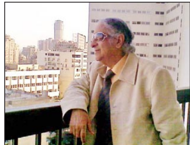
آخر صورة التقطت للراحل في القاهرة

توفي شيخ النقاد الموسيقيين العراقيين عادل الهاشمي، مساء الجمعة، أثناء مشاركته في مهرجان الموسيقى العربية في القاهرة، وقبل أن يحضر حفل الافتتاح إثر نوبة قلبية في فندق يحمل اسم أم كلثوم. وقال أعضاء في الوفد العراقي المشارك في مهرجان الموسيقى العربية بالقاهرة أنهم فوجئوا مساء الجمعة وقبليل توجههم إلى حفل افتتاح المهرجان في دار الأوبرا المصرية بوفاته الناقد الموسيقي المعروف عادل الهاشمي.