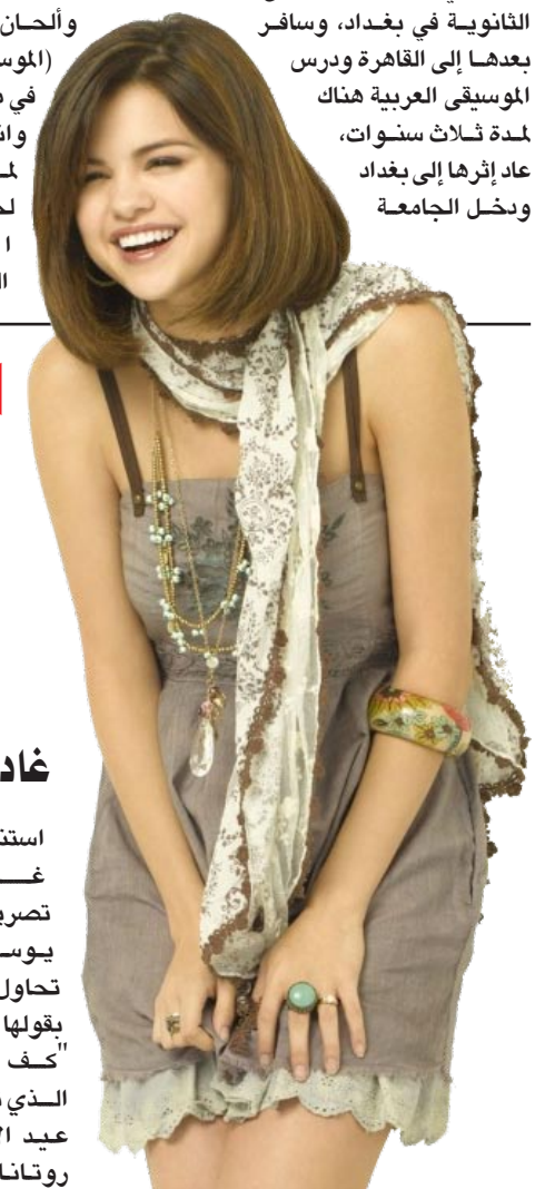
غادة عبد الرزاق

استنكرت الفنانة المصرية غادة عبد السرازق، تصريحات المخرج خالد يوسف قال فيها إنها تحاول استعطف الجمهور بقولها إنها هُمت في فيلم "كف القمر"، في الوقت الذي تقضي فيه إجازة عيد الأضحي مع ابنتها روتانا، وقالت غادة، "ماذا