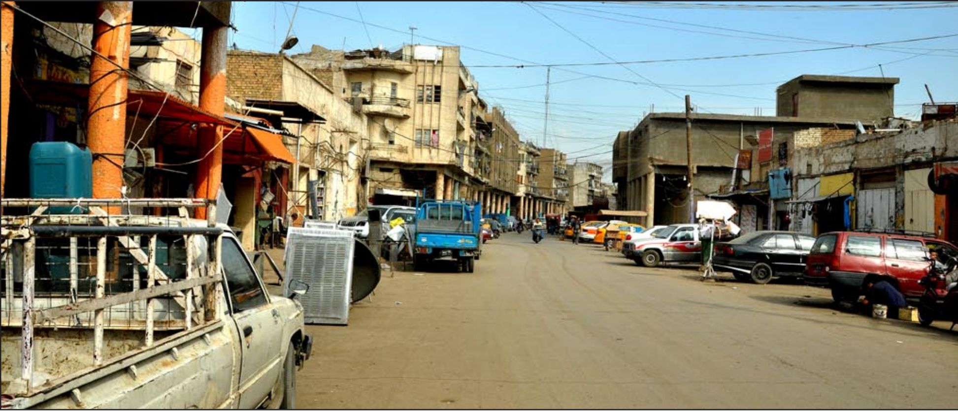
غياب الخدمات في كل شي