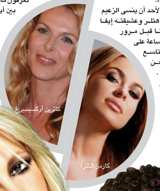
كارين أوكسنبيرغ كارمن الكترا

سبيرز وجيسون ألكسندر على الرغم من الفضائح التي رافقت طلاق بريتي سبيرز وكيفن فيرلاين، فقد استمر هذا الزواج أكثر من زوجها الأول بجيسون الذي انتهى بالطلاق بعد خمس وخمسين ساعة في لاس فيغاس في الثالث من يناير ٢٠٠٤. وفي وقت لاحق قالت: كنت في لاس فيغاس.. لم أستطع المقاومة.. أنتم تعرفون ماذا يحدث حين تفلت الأمور من بين أيدينا!