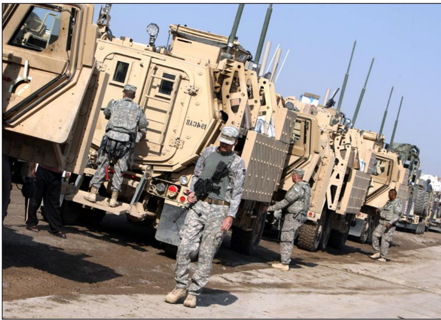
انسحاب القوات الاميركية من العراق (أرشيف)

نوري المالكي على الرغم من تمتع اغلب الأسماء بالكفاءة. وأشار إلى أن إصلاح مؤسسات الدولة الذي نادى به زعيم العراقية إياد علاوي بات مهماً وضرورياً من أجل تقويم وتحسين إدارة الدولة بشكل عام لأن البلد اليوم يمر في حالة خطيرة