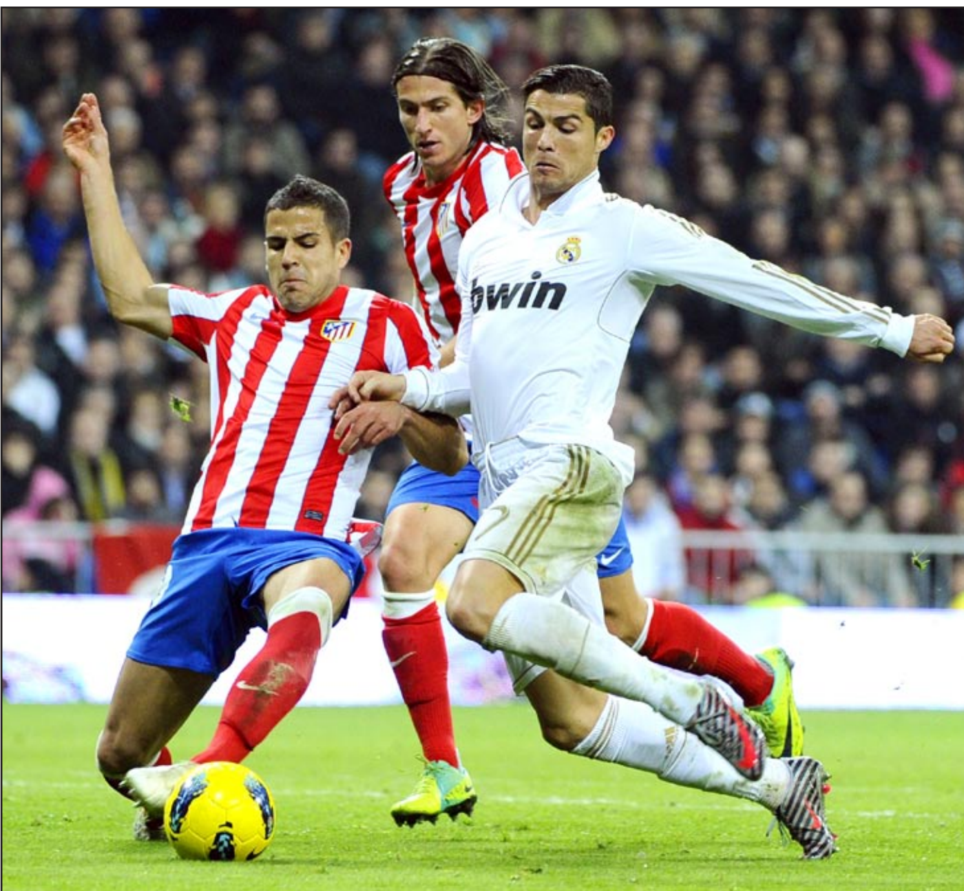
رونالدو سجل هدفين من ركلتي جزاء.

وفشل الملكي في تشكيل خطورة كبيرة على مرمى الأتلتيك في الشوط الأول، على الرغم من سيطرته على خط الوسط، ولكن من دون تهديد صريح على مرمى الضيوف، الذين تراجعوا لحماية الخطوط الخلفية واعتمدوا على الهجمات المرتدة، بالرغم من تعرض حارس اتلتيكو للطرد إلا أن الفريق لم يتأثر بالنقص العددي.