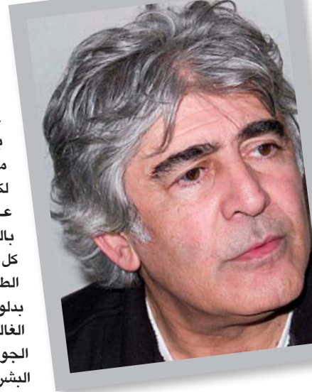
أنه يرمى حجراً فيسقط (عبر عدة بحار) على سقف بيته الذي لم يعد هناك (...), مساؤك أثير يا سركون