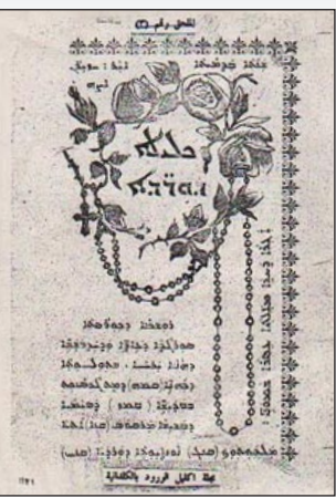
أول مجلة عراقية صدرت في الموصل عام ١٨١٠

عشر الميلادي في روما، وانتشرت في جميع انحاء العالم، وهي حركة دينية خدمية وثقافية ذات تنظيم محكم. وقد قدمت الى الموصل عام ١٧٥٠، واستمرت مركزا لها فيها، وتمكنت من فرض احترام المجتمع الموصل الذي تقبل نشاطها بكل رحابة صدر الى يومنا هذا. وقد شهدت الفترة منذ منتصف القرن التاسع عشر الى اوائل القرن