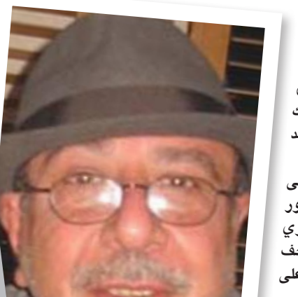
أنه يرمى حجراً فيسقط (عبر عدة بحار) على سقف بيته الذي لم يعد هناك (...), مساؤك أثير يا سركون

التعزّي أممي. هجمت الأحمالُ من لا مكان قطيعاً من الماشية حطم سياجاته، قوانين الطبيعة نكست أعناقها في هذا الصباح الممتمّن الأطراف، كجوهرة أرخبيس، وأنا في أنينا طموحي لا يتعدّى المروزّ خلصة أمام قبر سقراط في (الأغورا) والهروب لمدى غير محدد من مقبرة التفكير والكتابة. وتعلق ليلى السيد: لن نساك أيها الشاعر الأجل، فريد غسان زكتان: لنسّ للنبسيان. ويكتب وليد هرمز: الشاعر القديس سركون. أما رحمن النجار فيدون على حائطه مشاركاً أصدقاء مساؤك أثير يا سركون في تربتك البعيدة، حتى أن بمقدورك كما تقول هنا (والمهاجر يحمل