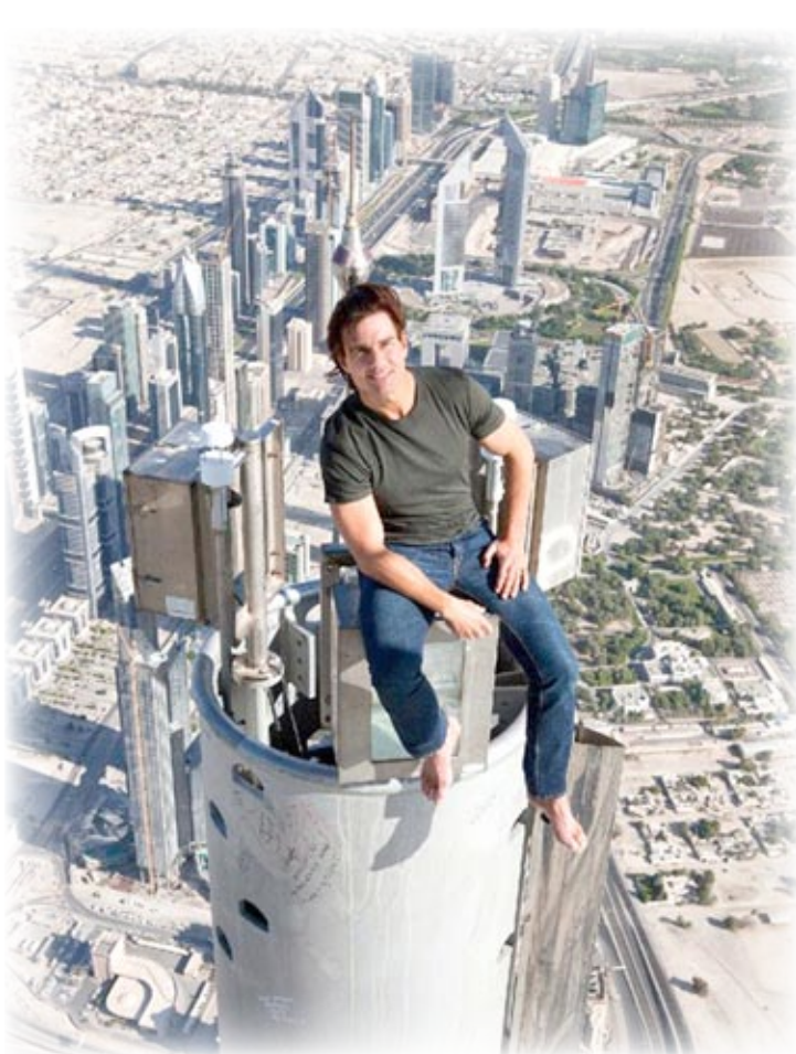
كروز في لحظة نادرة

بالقطع السينمائي العربي " . ومثلما كان فيلم ( المهمة المستحيلة- بروتوكول الشيخ) حدث المهرجان الأول ، استقطب المؤتمر الصحفي الذي عقده نجم توم كروز ومخرج الفيلم باهتمام كبير هنا في أوساط المهرجان ، فقد تحدث الاثنان عن تفاصيل مثيرة أثناء تصوير الفيلم.. وأشار كروز في المؤتمر الذي عقد في إحدى قاعات البرج إلى المصاعب التي واجهته في أثناء التصوير وهو يؤدي المشاهد بنفسه من دون بديل. وفي إطار المؤتمرات الصحفية قدم