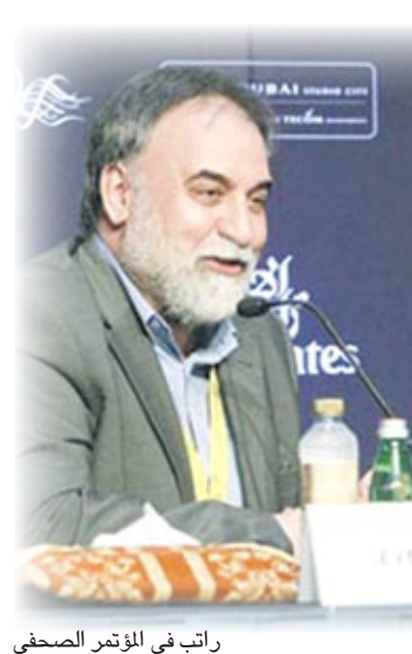
راتب في المؤتمر الصحفي

وقد استطاع المخرج إيستوود أن يقف في هذا الفيلم عند أهم المراحل المفصلية في التاريخ الأميركي الحديث على خلفية سيرة رجل كانت مهمته حماية بلاده وأسراره الشخصية التي وقف عندها الفيلم وبطريقة سرد مبتكرة بما يقدم إضاءات على جوانب مخفية من حياته وتاريخ بلاده، لم يكن يثق بأحد سوى دائرة ضيقة مقربة منه تتمثل بسكرتيرته هيلين غاندي وزميله كلايد تولسون المطع على كل مشاريعه الاستخباراتية ، ووالدته.. وركز المخرج على فلسفة إدغار في العمل لخدمة بلاده التي ترتكز على طرق كل الأساليب لتبرير غاية... استعان إيستوود في هذا الفيلم بعدد من أهم الممثلين الآن، وفي مقدمتهم ليوناردو دي كابريو الذي قدم أحد أهم أدواره في السينما خاصة مع تقمصه شخصية إدغار في مراحل زمنية مختلفة تصل به إلى الشيخوخة، إضافة إلى المخضرمه جودي ديتش، وأومي هاسر، ونعومي واثنس.