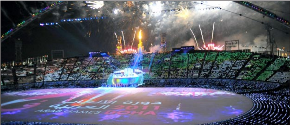
جانب من حفل الأنتاح

البطولة، وفي الوقت نفسه يسبوك لرياضيون العرب على أن سنوات التبع على المصائب وعلى تسجيل ملاعب كرة القدم الخضراء العربية.ومثل هذا القرار يعد ضربة معلم) من قبل اللجنة المنظمة. لأنها أرادت أن يصل مستوى البطولة الفني إلى درجة كبيرة، وربما يسبق المستوى الإعلامي والتنظيمي لها. لأن الحافز المادي للرياضيين سيبلغ دورا كبيرا في رفع حالة المنافس لدى الرياضيين جميعا، وسيستغل كل واحد منهم حتى وإن كانوا في منتخب عربي واحد أقصى ما لديه من جهد من أجل تحقيق المراكز التي يضع من خلالها على صدره إحدى الميداليات التي يجاب عليها. لأن أن يلعبوا دورا كبيرا في نجاح دورة الألعاب العربية فنيا بعد أن حققت هذا السورة وفي أول يوم لاتطلاقها نجاحا كبيرا في إقبال حفل الأنتاح بهذه الصورة الرائعة التي رسمت على جدول ملعب خليفة الدولي.