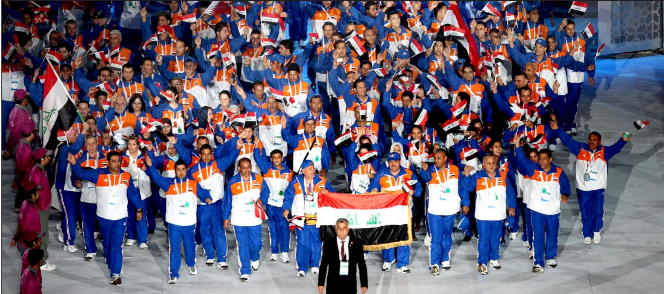
وفد العراق يستعرض في حفل افتتاح الدورة الرياضية العربية

المباراة كانت جيدة ويغض النظر عن النتيجة فإن اللاعب العراقي ابدى مقدره جيدة وهو في بداية الطريق وأنه لاعب صغير غير يحتاج للكثير من المشاركات في البطولات الخارجية لأنها المرحلة المهمة بالنسبة للاعب التنس ضيفيا إن فريق الكويت عازم على الفوز بالرغم من المنافسة القوية من فرق البريقيا: مصر وتونس والمغرب التي حصدتها الفريضة بوجودهم في مجموعة وخصوصا واحدة ، مشيرا إلى ان المباراة مع المنتخب الاماراتي غدا ستكون صعبة لتحديد صاحب المركز الأول في المجموعة.