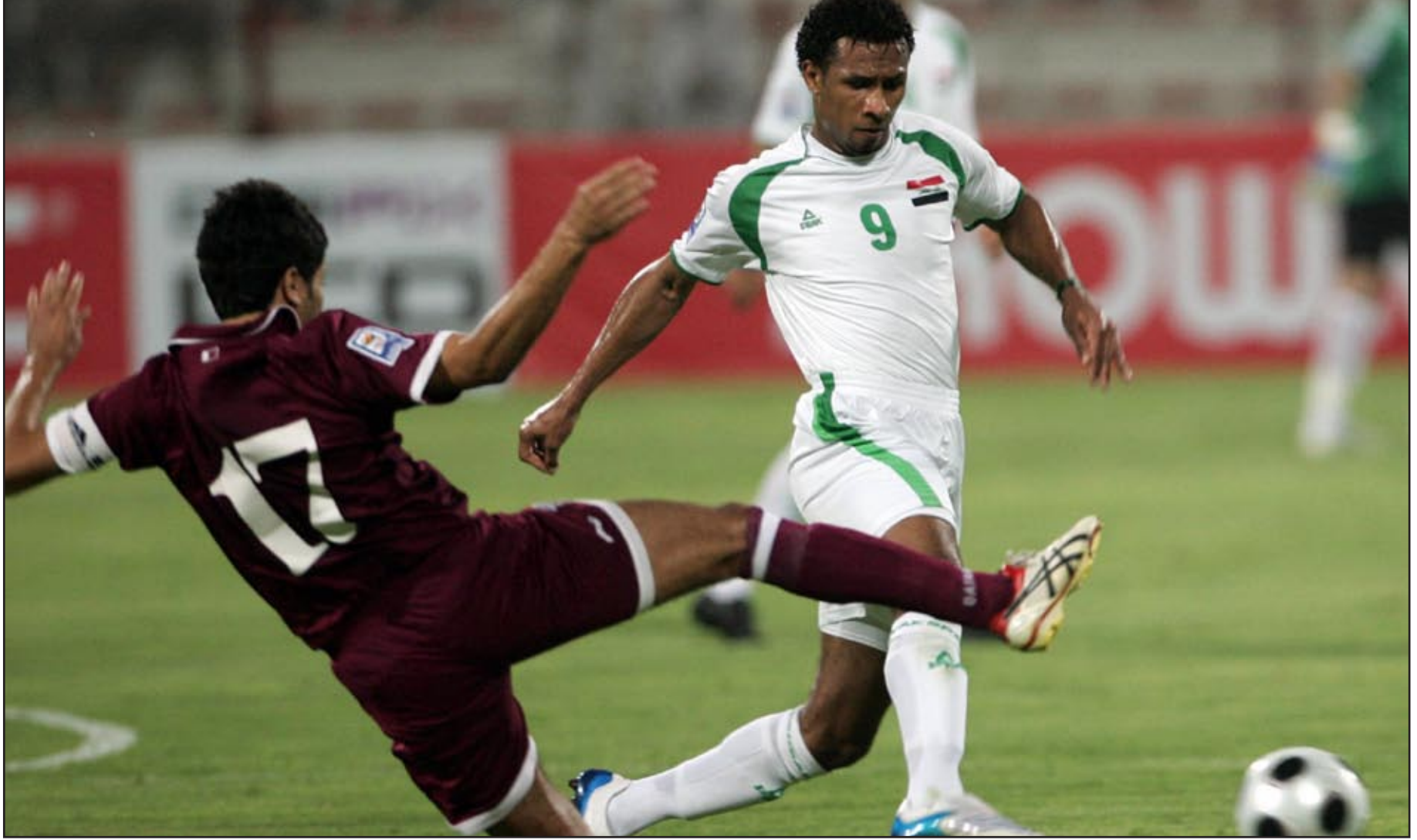
منتخبنا يسعى لرد الاعتبار أمام قطر في موقعة السد

صحفية بأنه لا يوجد منتخب سيلعب وهو مستسلم حتى لو كان خارج المنافسة. وأضاف: لا بد من أن اعتمد على نفسي ولا بد من أن أبذل قصارى جهدي من أجل عبور المباراة المقبلة أمام العراق، وأن تكون على قدر المسؤولية المقامة على عاتقنا، ولا بد من القول بأن اللاعبين بعد التعادل أمام البحرين كانوا يشعرون بالمسؤولية وأكدوا لي أن الكرة الآن أصبحت في ملعبهم، لذلك لا بد من تقديم كل جهدي على أن يبقى التوفيق بعد ذلك، مطالبا لاعبين منتخبه بأن يخوضوا المباراة المقبلة بروح قوية وبروح المجموعة الواحدة حتى يتمكن من تحقيق الفوز المطلوب، مشددا على أن الجماهير القطرية ليست بحاجة إلى دعوة من أجل الحضور ومساندة المنتخب.