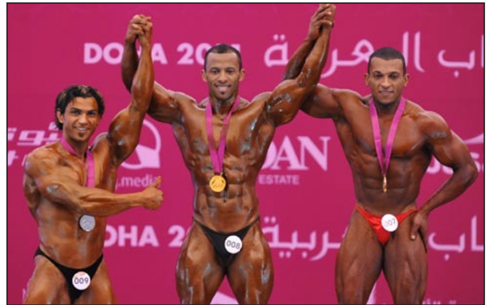
ميداليات كمال الأجسام تثير أزمة جديدة في الدورة العربية