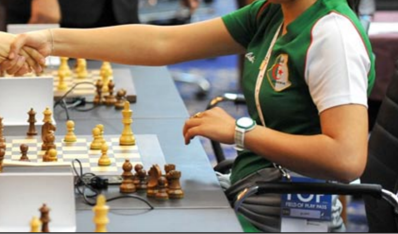
منتخب الشطرنج يتطلع للفضة

اصبحت فرصة شطرنجياتنا معمودة في التنافس على الذهبية التي ضمنها الفريق الجزائري الذي تربع على الصدارة في فرقي المنتخبين واثباتها الجولة السادسة التي جرت بخاتي الرصيف في اسبائر امس الاول الاثنين وسط حضور عشرين نغطة مما جعلهم يضمن الذهبية مع بقاء ثلاث جولات. ويخفق مصر في المركز الثاني بحصولها على ١٣ نقطة بعد تعادلهن مع قطر ٢-٢، وتشكلت كل من العراق والاندلس اللتان تتفوقا على قطر بعد خسارة لاعباتنا امام نظيرتهن الايردنيات وسط مفاجاة لتفوقات نتائجنا لعاملتنا في الجولات الست الاخيرة والمباريات الاخيرة للدور الحاسم للقاء نهائيات (السامية) وفي دورة الالعاب العربية التي دخل منتخبنا الوطني منافسا ومرشحا فويا للفوز باللقب فيها وخرج منها بخفي خسر؛ والموضوع بقلية.