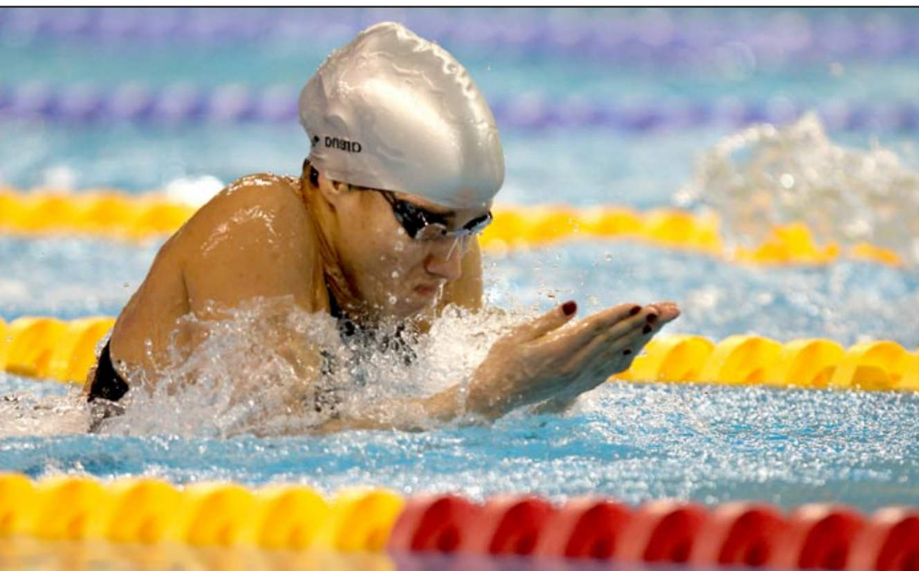
مصر في قمة لآلة السباحة

منافسات الرجال حتى الآن. وتتصدرت مصر منافسات الدورة العربية في نسختها الثانية عشرة التي تقام في قطر وهي وجمع الرياضيون المصريون ١٨٠ ميدالية متنوعة منها ٢٧ ذهبية.