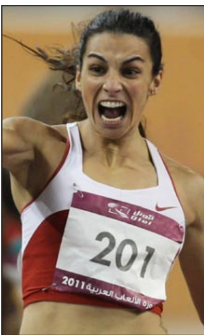
جريتا تطلق صرخة الفوز

رفض الطبيب ابو العباس رئيس بعثة كرة اليد السودانية بدورة الالعاب العربية بالدوحة المتقدرا على نتائج كرة اليد وبزخ الخسائر العارضة عن الاشارات له من منتخب السودان خلال المباريات لعبها التي تعسر بالبعد عن المباريات الخارجية وعدم الاستعداد للبطولات الدولية والقارية والاقليمية بمستوى الدول العربية إضافة إلى الفارق الامكانيات بين السودان والدول العربية وقال ابو العباس: ان ما حدث لنا كنا عبيدين عن الاشارات له من منتخب السودان خلال المباريات لفقر الامكانيات وبنينا ببرامج لسنوات عدة كما انه من الاسباب التي تساعد على