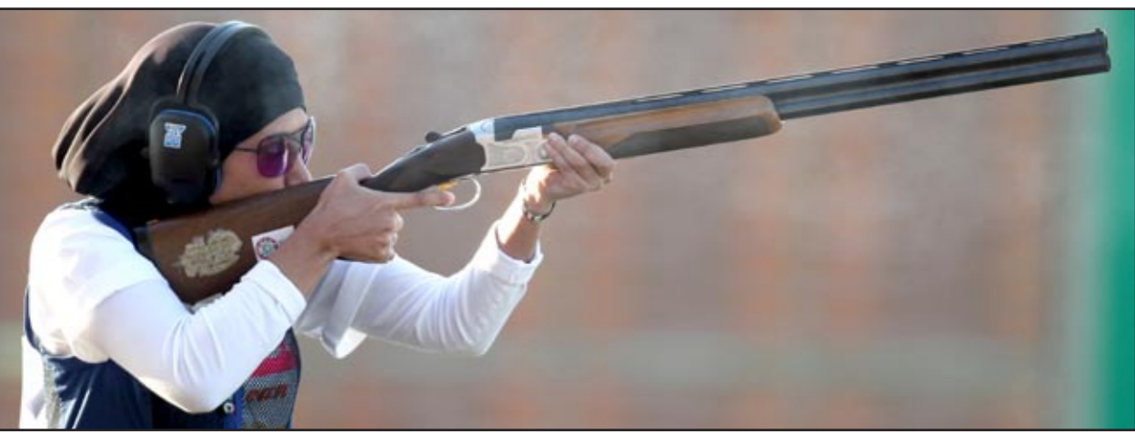
تفوق قطري في منافسات الرماية

بحالفها بالظفر بالمرکز الاول اضافة إلى تفوق ارميات الكويت في هذه المسابقة. وأكدت انها ستسعى جاهدة في الإستحقاقات المقبلة إلى الظفر بأحد المراكز المتقدمة التي من شأنها ان ترفع اسم قطر عاليا في المحافل الآسيوية والعالمية.