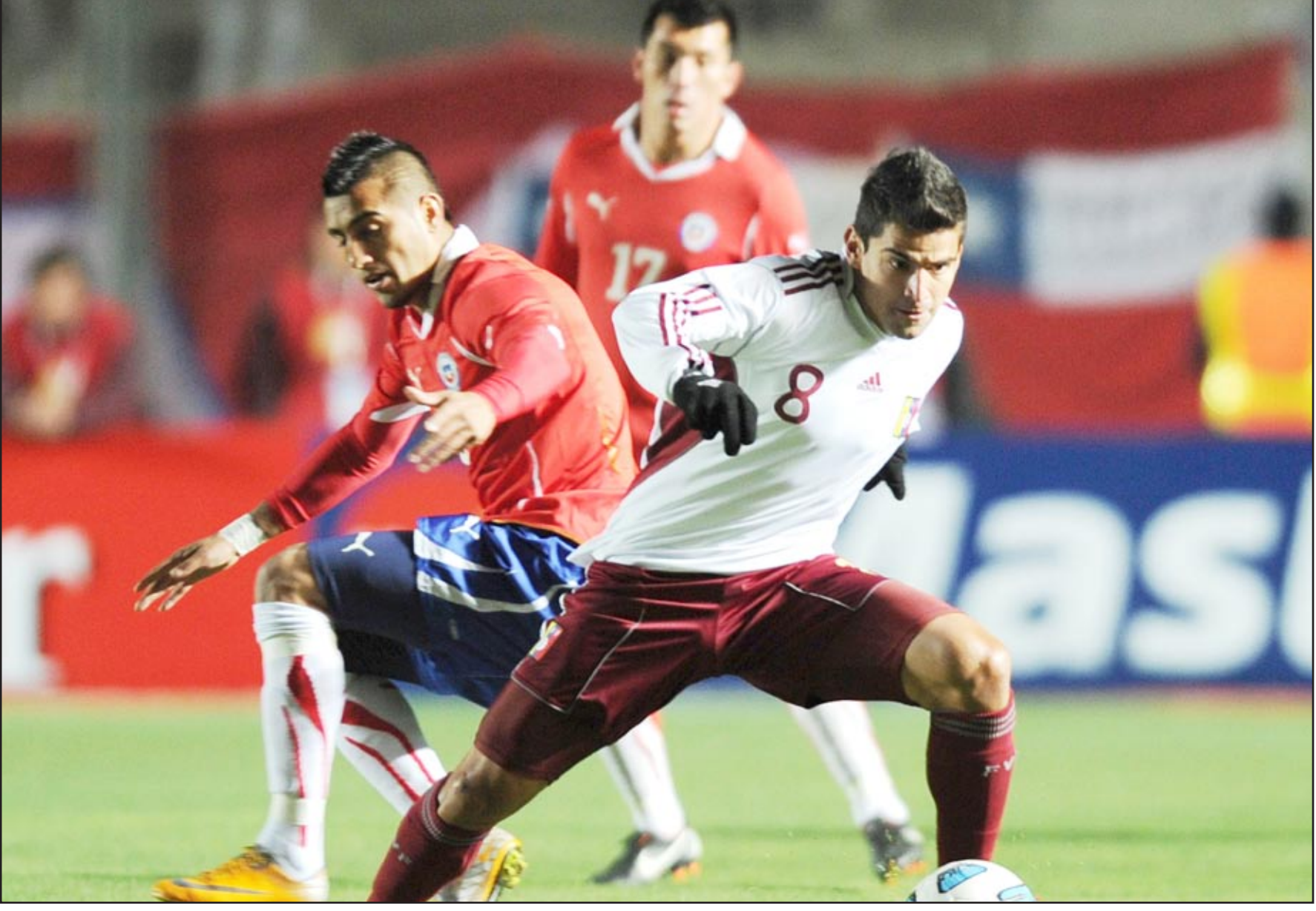
الكرة الفانزويلية تفرض احترامها في كوبا اميركا

أثبتت فنزويلا في ٢٠١١ أن مستواها في كرة القدم كان صاحب القدر الأكبر من التطور في أمريكا الجنوبية، ورغم أن الوقت لا يزال مبكراً على التفكير بأن الدول البوليفارية باتت قادرة على تعديل موازين القوى في النصف الجنوبي من الأمريكتين. فتحت قيادة المدرب سيزار فارياس، أو "مورينيو الفنزويلي"، تقدم منتخب "العنابي" حتى الدور قبل النهائي لبطولة كوبا أمريكا بالأرجنتين، وأنهى العام متساوية في المركز الأول من تصفيات كأس العالم ٢٠١٤ بالبرازيل مع أوروغواي والأرجنتين، ومتخلفاً عنهما بفارق الأهداف فقط. وقال فارياس "نود أن نحترمنا أمريكا الجنوبية" والمستوى والنتائج يثبتان أن الفريق الذي كان ينظر إليه على أنه حصاد القارة قد يلعب في البرازيل برغم أنه لا يزال يتبقى ٢٠ شهراً، و١٤ مباراة لم تلعب، بعد على نهاية التصفيات. وحتى الآن، تبدو فنزويلا وحدها في رد الفعل المفاجئ، فالإكوادور لا تزال تبدو في مرحلة التأهيل مع المدرب الكولومبي رينالدو رويدا، وكولومبيا فقدت المدرب وفقدت معه الثقة، وبوليفيا لا تزال كما هي فريق يكافح في بعض المباريات، بينما تظهر بيرو بإدرات على أن التحسن البادي في مستواها قد يتوقف. ولا يزال التفوق جنوبياً، ويحمل هذه المرة اسم أوروغواي. وهناك إجماع على أن فريق المدرب أوسكار واشنطن تاباريز هو الأكثر تالقاً في القارة. وبعد احتلال المركز الرابع في مونديال جنوب أفريقيا ٢٠١٠، جاء التتويج في كوبا أمريكا، والآن يتصدر الفريق التصفيات الموندiale، بينما يضيف نجوم مثل لويس سواريز ودييغو فورلان صورة الفريق الذي لا يقهر على