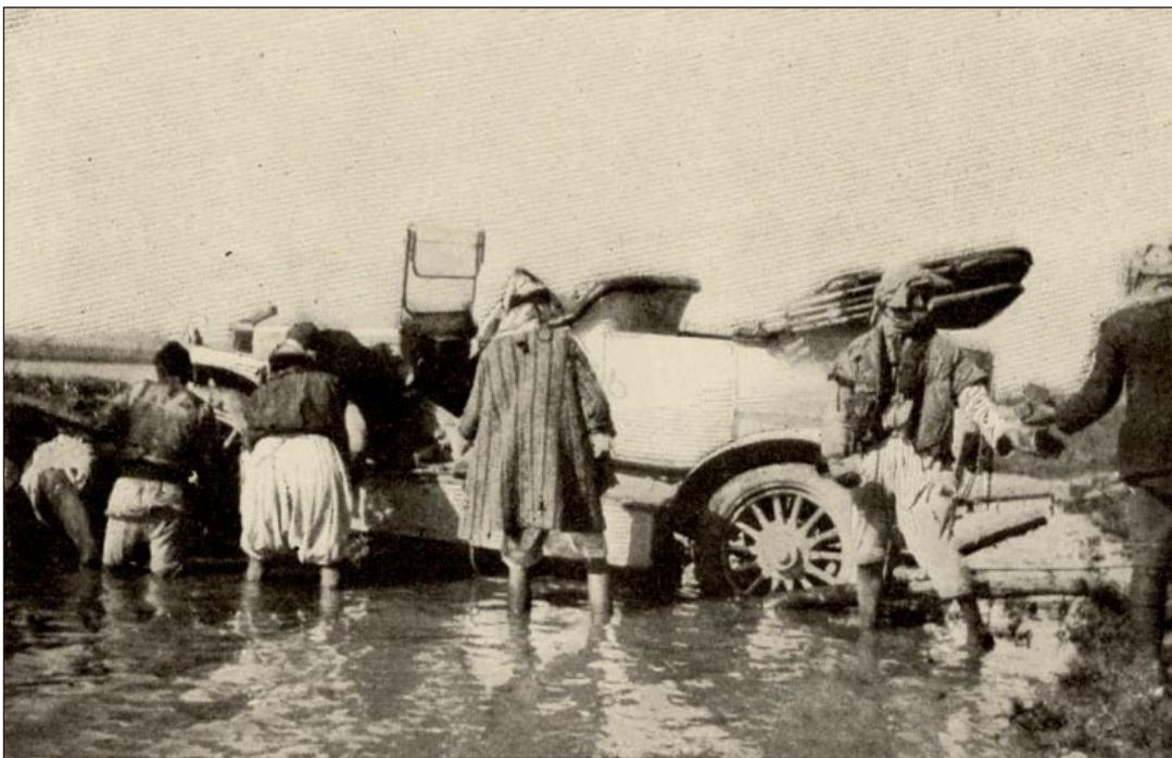
دخول اول سيارة للعراق