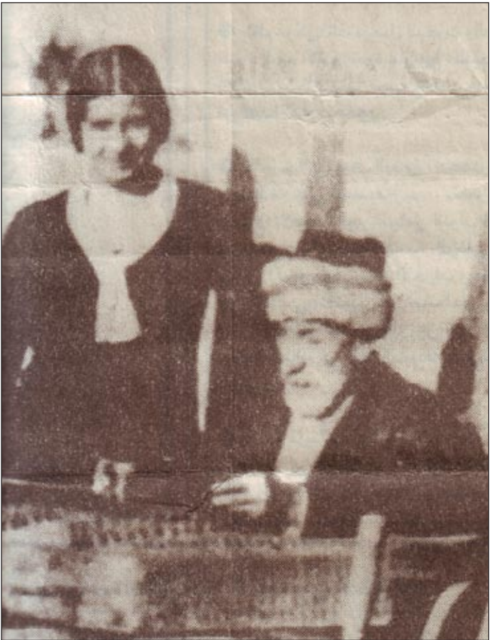
لم كلثوم في بيت يوسف زعرور الكبير في بغداد عام ١٩٢٢

والمناسبات، وكان في امكان صاحب الدعوة ان يحدد المغني الذي يصاحب الفرقة، و الطلب يزداد بشدة ايام شهر رمضان والوصلة الغنائية تبدأ عادة مساء وتستمر حتى الصباح