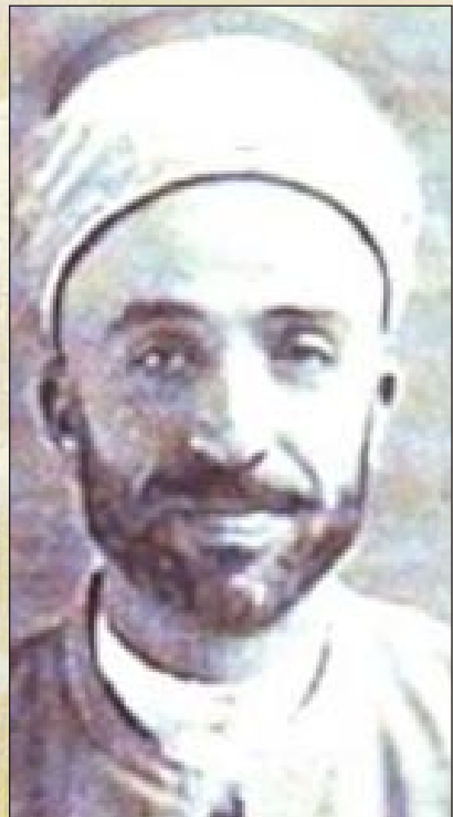
جعفر ابو التمن

اعلان الانفصال عن بغداد ولما عرض العمري الامر على المسؤولين في لواء الموصل وهم جلال خالد وكيل المتصرف ومدير الشرطة اللواء درويش لطفي لم يعارضاه وعليه امر اللواء العمري بتوقيف العقيد انطون لوقا موفد الحكومة من بغداد الى الموصل لاجراء التحقيق كما امر بحرق الاوراق التحقيقية التي نظفها العقيد لوقا ثم توقيف الضباط المواليين للفريق صدقي في الموصل ومنهم العقيد احمد حمدي والرائد خليل مخلص والرائد احمد فخري واطلاق سراح الضباط الموقوفين بتهمة المشاركة في التخطيط لعملية الاغتيال.