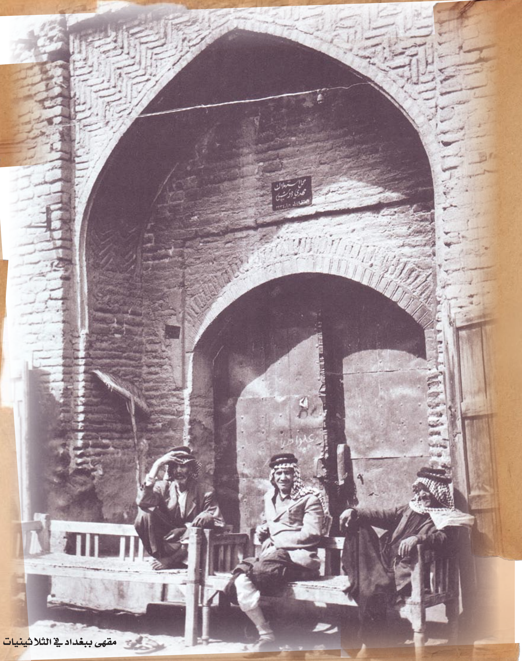
مقهى بغداد في الثلاثينيات