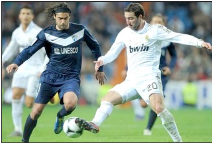
اساسيو الريال يتخطون ملقا