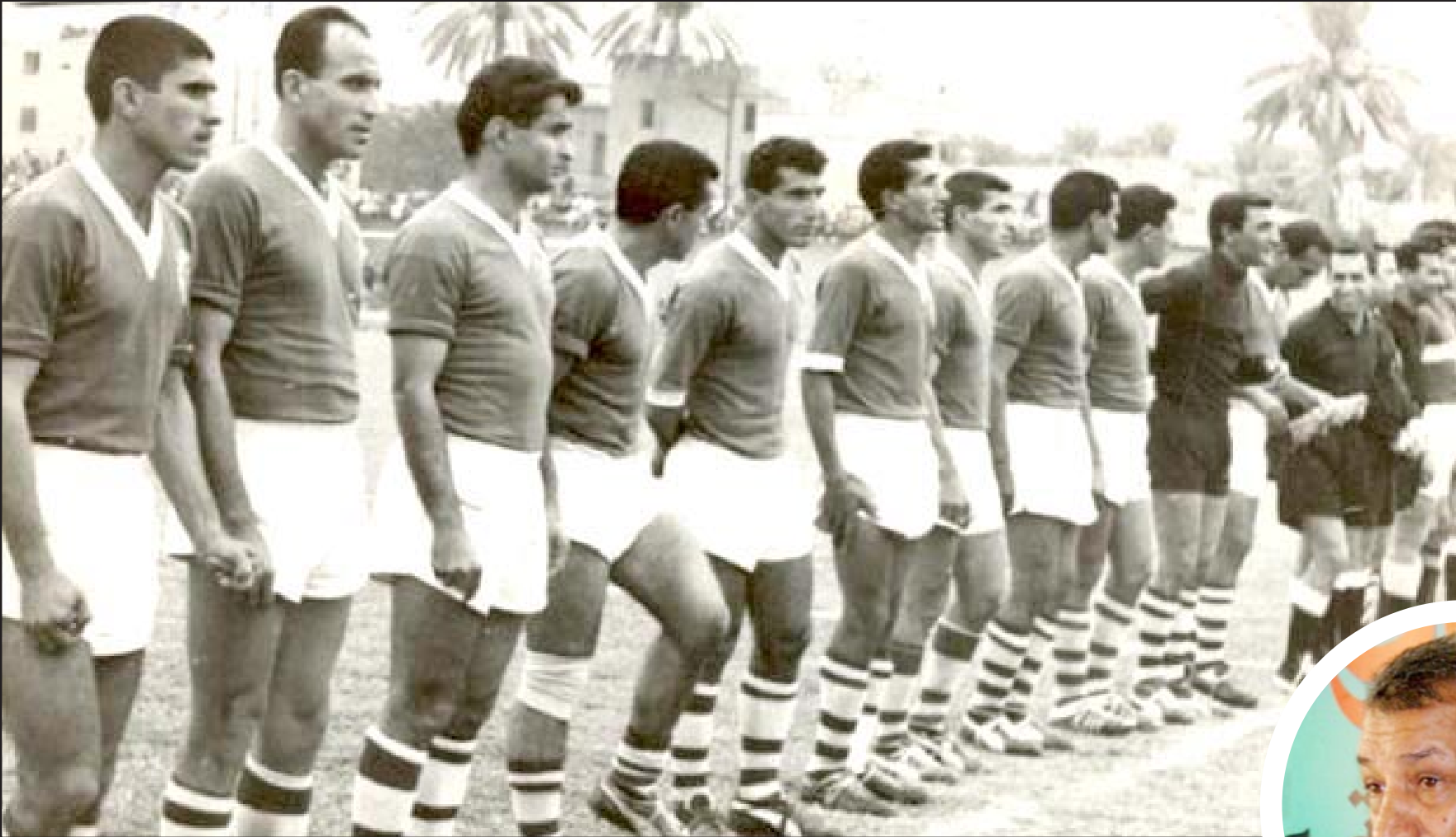
نجوم رحلت وأخرى تواجه دوامة النسيان

الرجل أفنى حياته كلها في تشجيع المنتخب العراقي وفي مختلف الألعاب وكان يترك عائلته ويسافر إلى مختلف الدول والقارات في سبيل تحفيز لاعبيها في بلاد الغربية على تحقيق الفوز. أن جميع الأشخاص الذين ذكرناهم أعلاه يستحقون الاهتمام والرعاية من المؤسسات المعنية سواء من الجانب الإنساني أو من الجانب الرياضي، لأنهم لم يخلوا على بلدهم بأي جهد يذكر وأرى أن الوقت بات ملائماً لكي يُرد لهم الجليل... وكل عام وبلدنا وشعبنا ورياضتنا بألف خير.