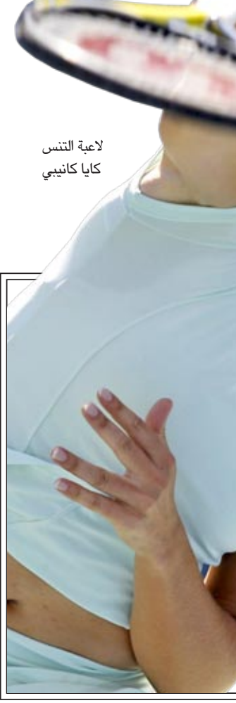
لاعبة التنس كايا كانيبى

المباراة. وفي ما يتعلق بعدم رغبة النجم البرتغالي كريستيانو رونالدو في الاحتفال بهدفه الخامس، حيث بدأ حزينا بعد تسجيل الهدف، علق كارانكا "كريستيانو لاعب ذو خبرة طويلة. سوء التوفيق كان يلازمه في هذه المباراة وأمام ملقا أيضاً. ولكن بعد تسجيله الهدف أخرج شحنة من الحزن بداخله ولم يشأ الاحتفال لأنه لم يكن مهياً لذلك نفسياً". وبخصوص استبعاد الظهير الأيمن الدولي ألبارو أربيلو من قائمة اللاعبين الـ ١٨، أشار كارانكا إلى أنه "قرار فني لأن اللاعب لم يكن على أتم الاستعداد للعب". وامتدح كارانكا مستوى غرناطة الذي بدأ خصماً عنيداً ونجح في التعادل في الشوط الأول، كما لعب بخطوة منظمة وأغلق المساحات على لاعبي (الميرينكي).