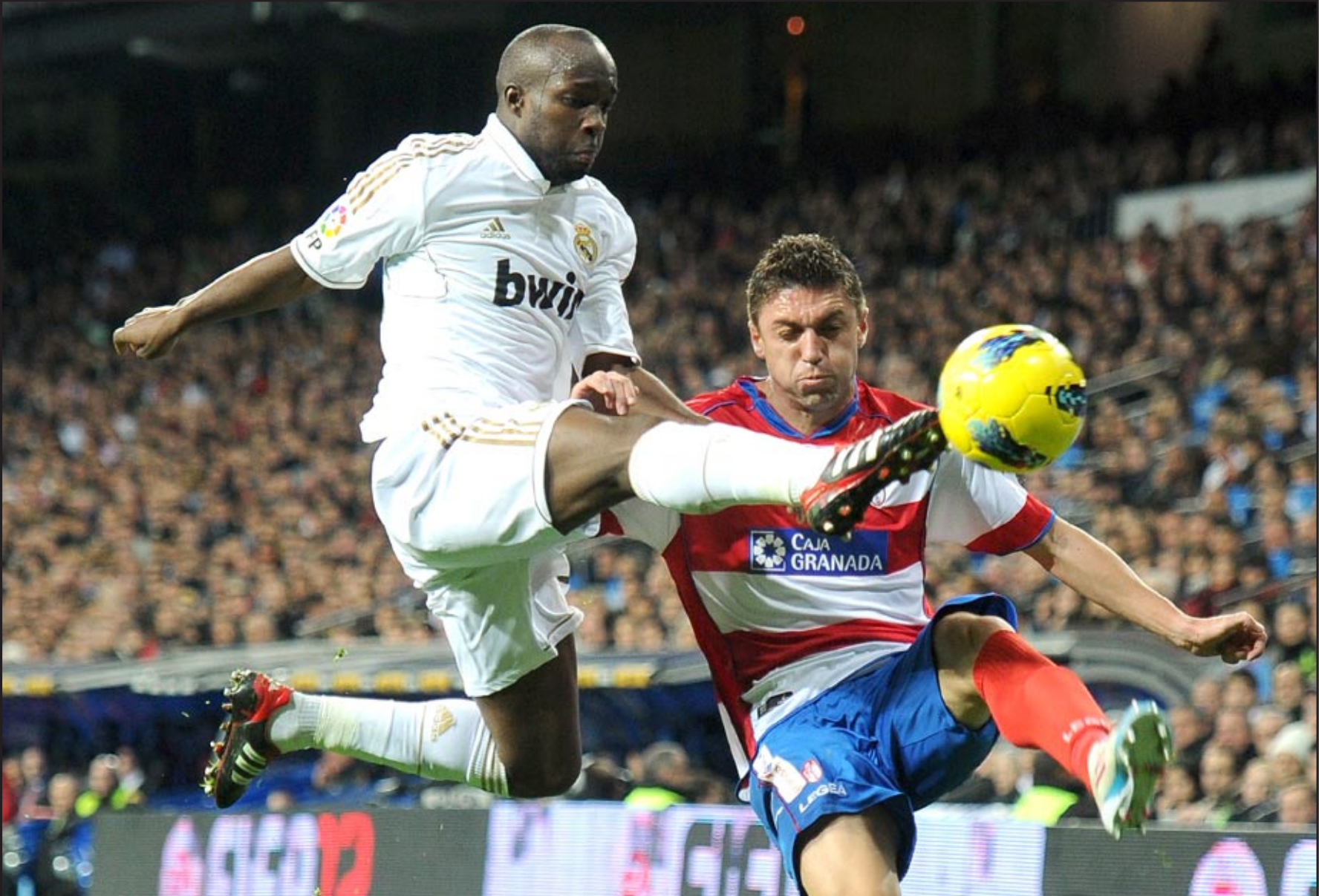
ريال مدريد يضيف ثلاث نقاط لرصيده

ونجحت الخطة بالفعل، وأضاف هيغواين الهدف الثالث مطلع الشوط الثاني بعد مؤازرة من البرازيلي مارسيلو (٤٧)، اتبعه بنزيمة مباشرة بهدفه الثاني الشخصي والرابع