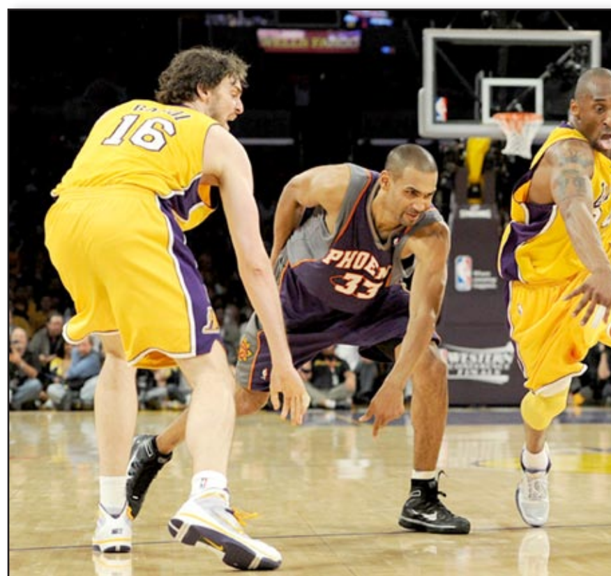
براينت يتخطى حاجز الثلاثين نقطة

تابع كوبي براينت عروضه القوية وسجل ٣٩ نقطة منها ٢٦ في الشوط الثاني ليقدّم لوس انجليس ليكرز إلى الفوز على غولدن ستايت ووريترز ٩٧-٩٠ في دوري كرة السلة الأميركي للمحترفين.