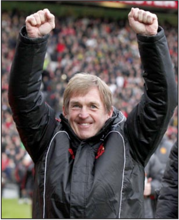
دالغليش يتنق على اداء ليفربول