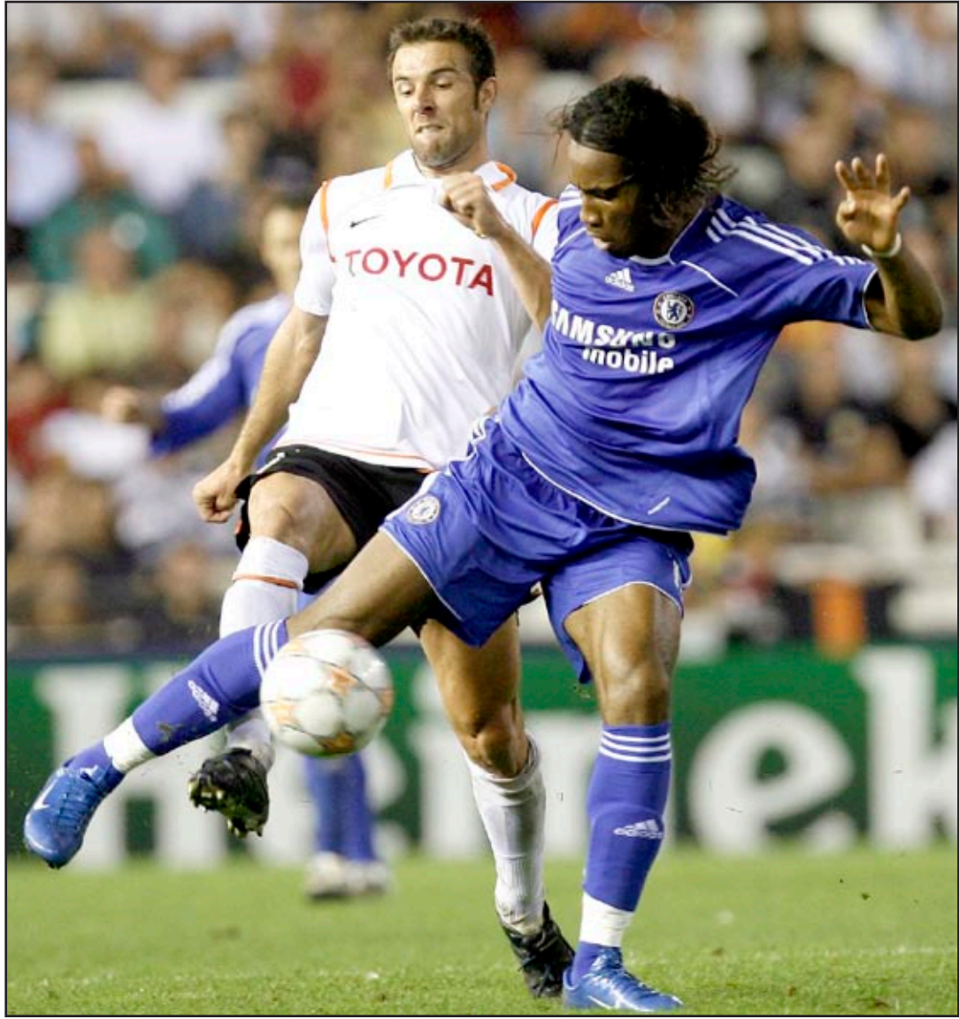
كأس الأمم الأفريقية تلقي بظلالها على البريمرليغ

وسيعيب الشقيقان عن مباراتي الدور قبل النهائي لكأس رابطة الاندية الإنكليزية امام ليفربول الى جانب مباراة الفريق على ارضه امام توتنهام في الثاني والعشرين من كانون الثاني.