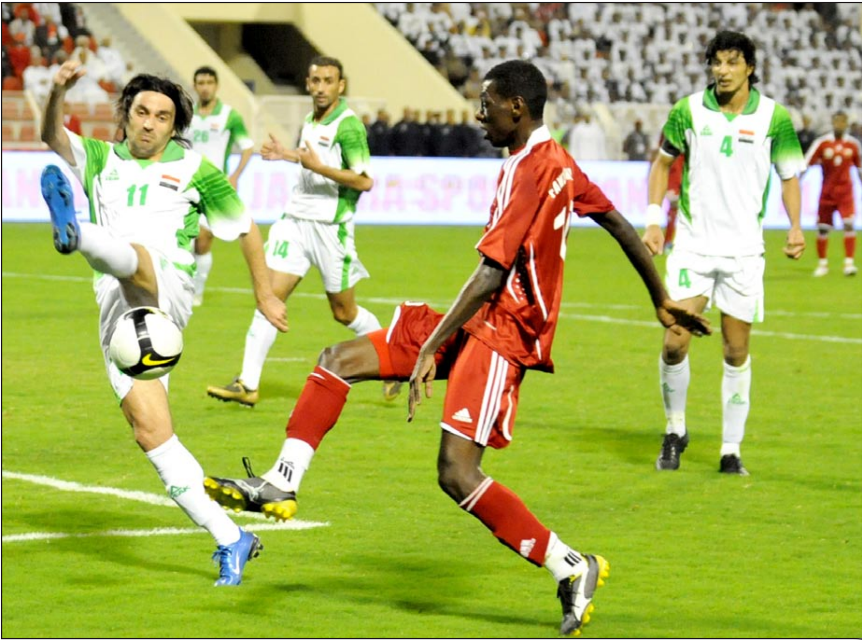
أسود الرافدين في إحدى المباريات السابقة