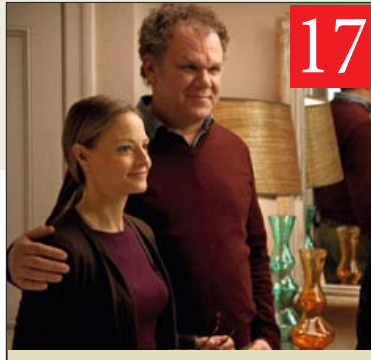
دراما المثقفين لبولانسكي ليست معددة بما يكفي