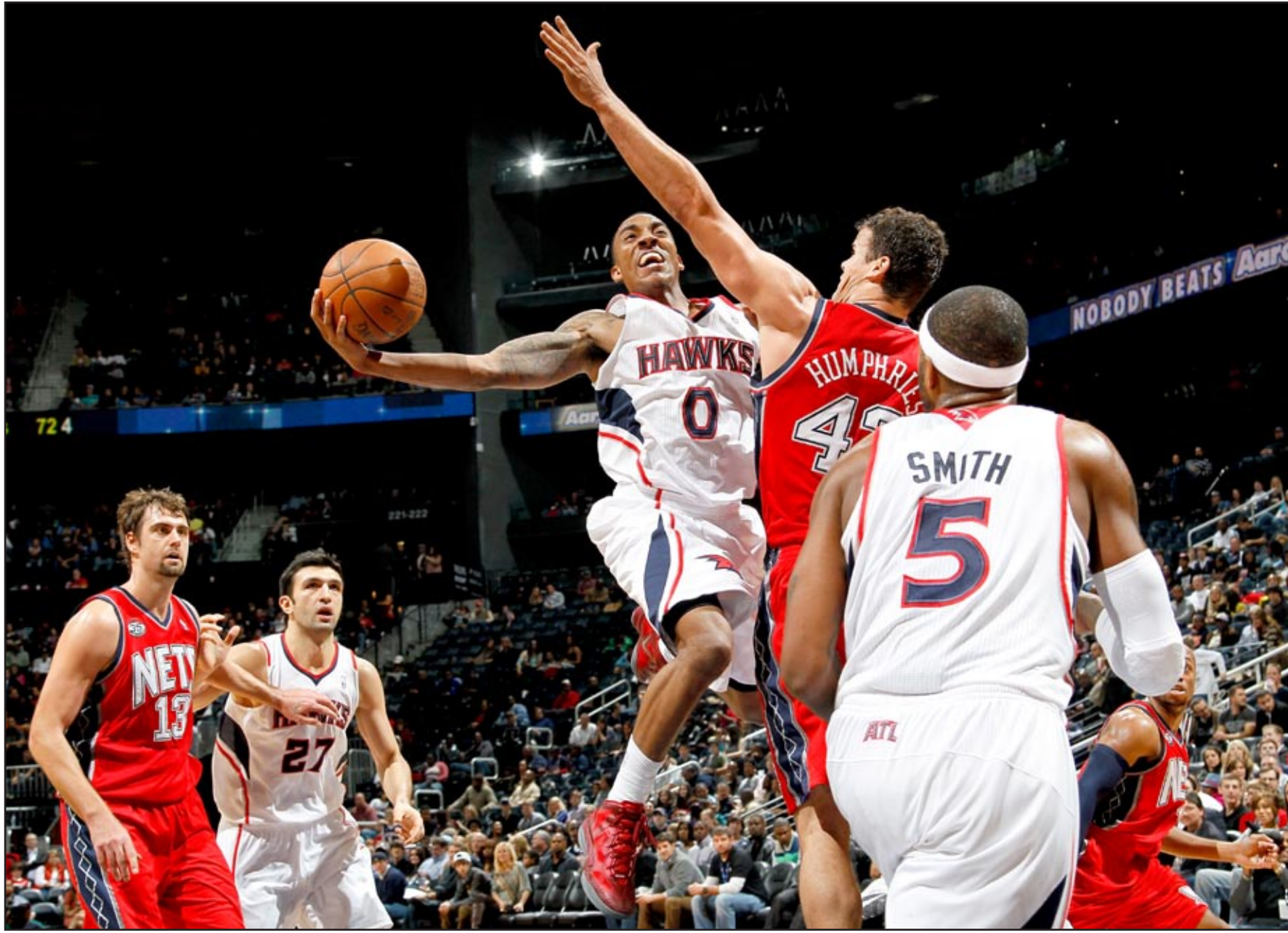
كارلوس بوزر يقود شيكاغو الى فوز جديد

وعلى ملعب "روز غاردن" وامام ٢٥٥٩٩ متفرجا، واصل الثنائي كيفن دورانت وراسل وستبروك تألقهما وقادا فريقهما اوكلاهوما لاحقا الهزيمة الثانية فقط بيبورتلاند بين جماهيره في مباراة حسمت بعد شوط اضافي ١١١-١٠٧. وكان دورانت افضل لاعبي المباراة بتسجيله ٣٣ نقطة، بينما سلة استعراضية في آخر ١١-٢٩ ثانية من الشوط الاضافي، فيما ساهم وستبروك بـ ٢٨ نقطة مع ١١ متابعة وجيبس هاردين ١٩ نقطة في مباراة تخلف خلالها