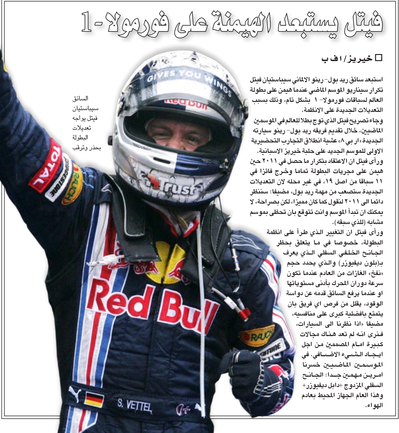
السائق سباستيان فيتل يواجه تعديلات البطولة بحذر وترقب

استبعد سائق ريد بول-رينو الألماني سباستيان فيتل تكرار سيناريو الموسم الماضي عندما هيمن على بطولة العالم لسباقات فورمولا-١ بنسك تام، وذلك بسبب التعديلات الجديدة على الانظمة. وجاء تصريح فيتل الذي توج بطلا للعالم في الموسمين الماضيين، خلال تقديم فريقه ريد بول-رينو سيارته الجديدة «ار بي ٨» عشية انطلاق التجارب التحضيرية الاولى للموسم الجديد على حلبة خيريز الاسبانية. ورأى فيتل ان الاعتقاد بتكرار ما حصل في ٢٠١١ حين هيمن على مجريات البطولة تماما وخرج فائزا في ١١ سباقا من اصل ١٩، في غير محله لان التعديلات الجديدة ستصعب من مهمة ريد بول، مضيفا: سننظر دائما الى ٢٠١١ لنقول كما كان مميزا، لكن بصراحة، لا يمكنك ان تبدأ الموسم وانت تتوقع بان تحظى بموسم مشابه (لذي سبقه). ورأى فيتل ان التغيير الذي طرأ على انظمة البطولة، خصوصا في ما يتعلق بحظر الجانج الخلفي السفلي الذي يعرف بـ(بلون ديفيوزر) والذي يحدد حجم «نخ»، الغازات من العادم عندما تكون سرعة دوران المحرك بأدنى مستوياتها او عندما يرفع السائق قدمه عن دواسة الوقود، يقلل من فرص اي فريق بان يتمتع بافضلية كبرى على منافسيه، مضيفا «اذا نظرنا الى السيارات، فنرى انه لم تعد هناك مجالات كبيرة امام المصممين من اجل ايجاد الشيء الاضافي. في الموسمين الماضيين خسرتنا امرين مهمين جدا: الجانج السفلي المزودج +دابل ديفيوزر+ وهذا العام الجهاز المحيط بعادم الهواء».