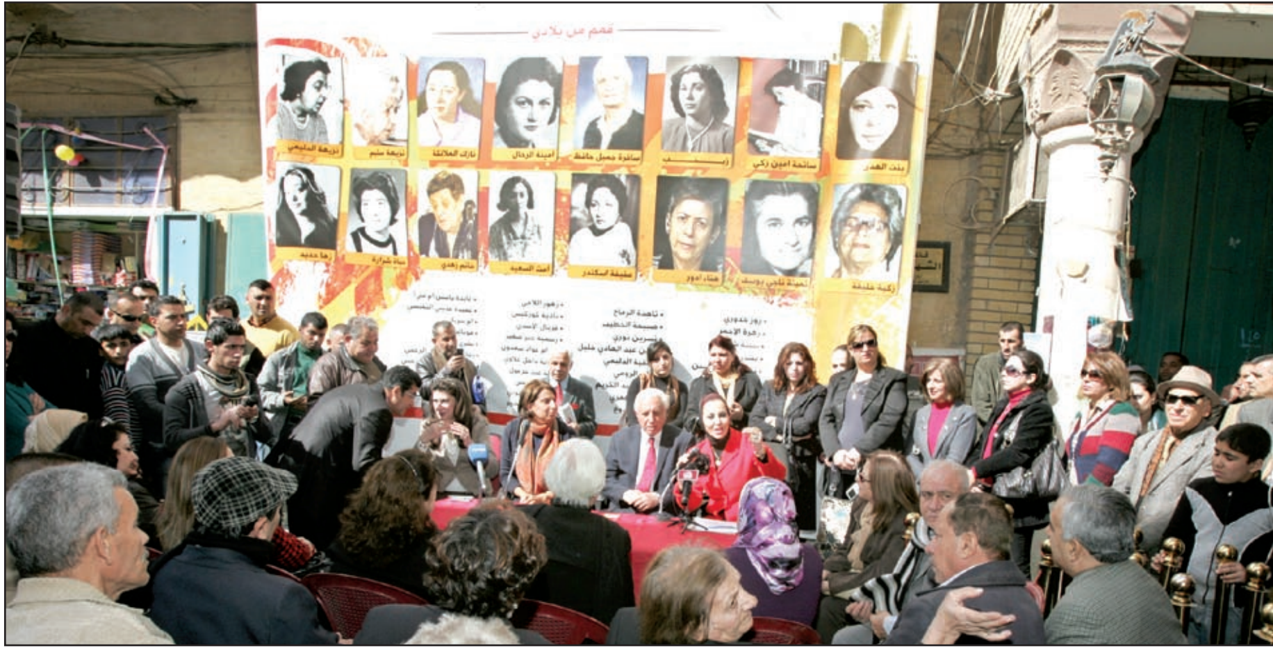
جانب من فعالية المدى للتضامن مع نساء العراق من أجل حقوقهن وحريةتهن ودورهن في الحياة...

شككت لجنة النزاهة في مجلس النواب، ما أسمته بالضغوطات السياسية التي يتعرض لها القضاء، والتي أدت وحسب أعضاء في اللجنة إلى تأخير حسم الكثير من ملفات الفساد المهمة المتهم فيها مسؤولون كبار في الدولة، في حين أرجعت تعطيل رفع ملفات فساد وزارة الدفاع إلى التفجير الذي استهدف مكتب تحقيقات الرصافة التابع لهيئة النزاهة مطلع العام الحالي.