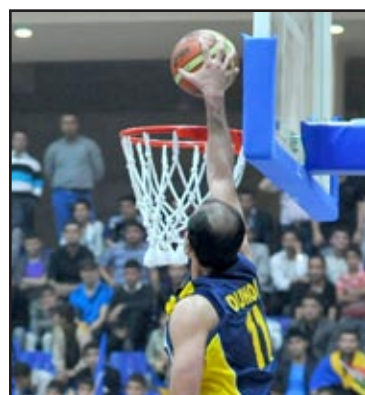
السلة تناقش المستوى الفني لاندية بغداد